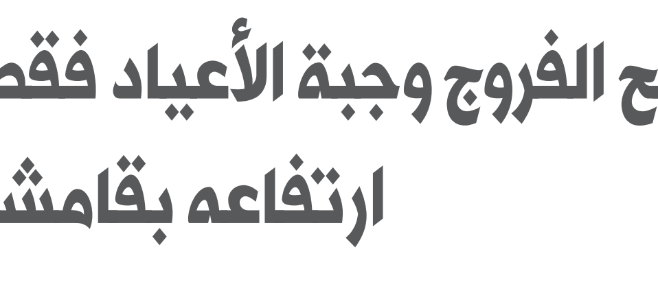
كامشلو/ روى النايف - ارتفاع أسعار اللحوم يُثقل كاهل المواطن ويزيد من أعبائه، فالخالد المحدود لا يسمح لأهالي ب شراء كل ما تحتاجه العائلة من احتياجات يومية، والسؤال المطروح: هل سيصبح الفروج وجبة الأعياد فقط!!

السوري، الباحث عن منتج رخيص الثمن بسبب قلة المورد، إن كان قياساً بمتطلبات الحياة والأسعار المفروضة أو قياساً بالعملات الصعبة.