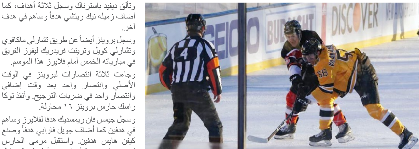
سحق بوسطن بروينز منافسه فيلادلفيا فلايرز ٧-٣ في دوري هوكي الجليد بأمريكا الشمالية ،