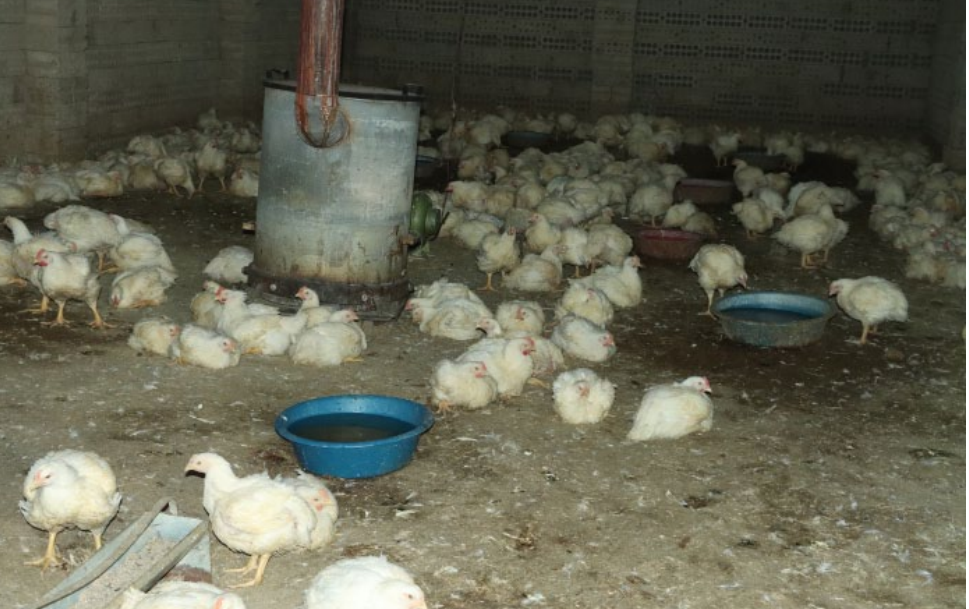
محجرة الصفحة – بيريفان حموي

ارتفاع سعر الدولار الذي أدى بدوره إلى ارتفاع سعر العلف فأصبح العلف ذو تكاليف باهظة خرجت كلياً عن قاموس مشتريات المستهلك