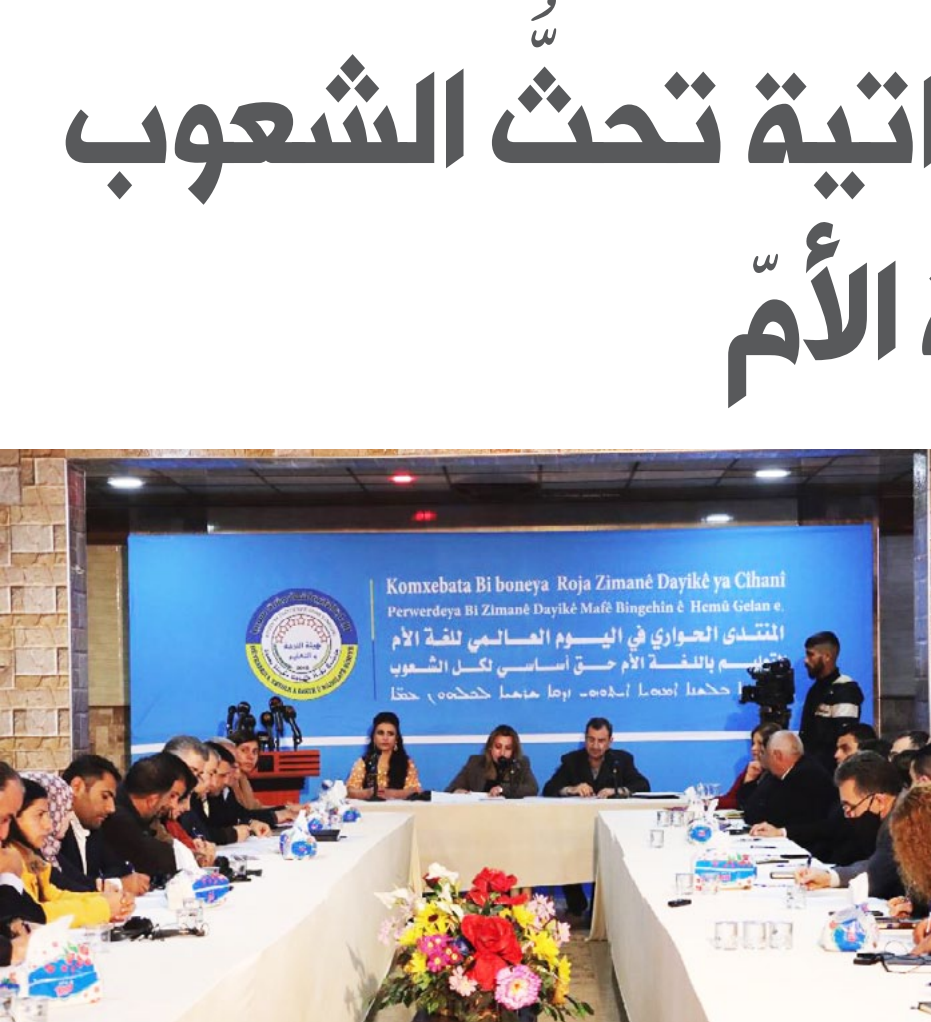
الذاتية أعطت الحق لكل شخص الحرية في التعلم والتحدث بلغته»، وتضيف: «إن هذا اليوم هام جداً من بداية الثورة حتى الآن، فاطفاننا الطلاب يتعلمون بلغة الأم، وهذا سيؤمن لهم مستقبلاً ناجحاً ومليئاً بالعلماء، عندما يتعلم أي طالب بلغته فإنه سيتعرف على مجتمعه وعلى عاداته وتقاليده».