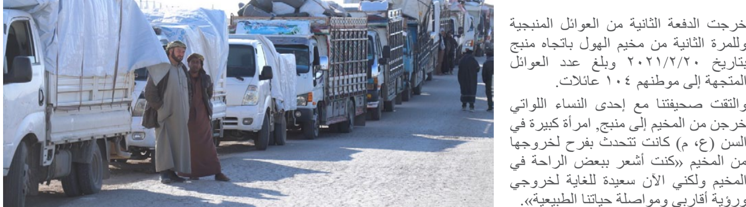
خرجت الدفعة الثانية من العوائل المنجبية للمرة الثانية من مخيم الهول باتجاه منبج بتاريخ ۲۰۲1/۲/۲۰ وبلغ عدد العوائل المتجهة إلى موطنهم 1۰۴ عائلات.

الحسكة/ كوئي مصطفى - خرجت 1۰۴ عائلات من مخيم الهول إلى منبج، فيما عبرت إحدى النساء عن فرحها تبتداً من جديد حياة طبيعية مع أقاربها.