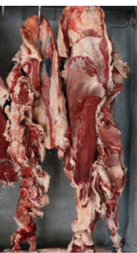
محجرة الصفحة – بيريفان حمي

صحيفتنا أنهم يراعون القساكين «الجزارين»، والقدرة الشرائية في المجتمع ويحذون على هذا الأساس القوائم المُسمّرة، والجزارون لا يتضررون كما يقولون بل يستفيدون حسب التسعيرة المحددة، ولكن الاحتكار المستمر يدفع بعلو إلى زيادة أصناف مصنّعة إلى الأسعار، وقد شددت لجنة تحديد الأسعار والتنمين على ضرورة تعاون الأهالي مع التنمين لضبط الأسعار، فالإدارة تستقبل شكاوى المواطنين وتُعلم الشاغل ضبط الأسواق، فهم يطمنون أن يشتكي أحداً ما على تاجر محدد يدورهم لن يفضّحوا عن اسم صاحب الشكوى، بل يسعون على الدوام لخدمة الأهالي، وهذه الأرقام مخصصة لاستقبال شكاوى المواطنين (٠٩٣٠٢٢٨٩١٠) - (٠٩١١٦٠٩٢٦).