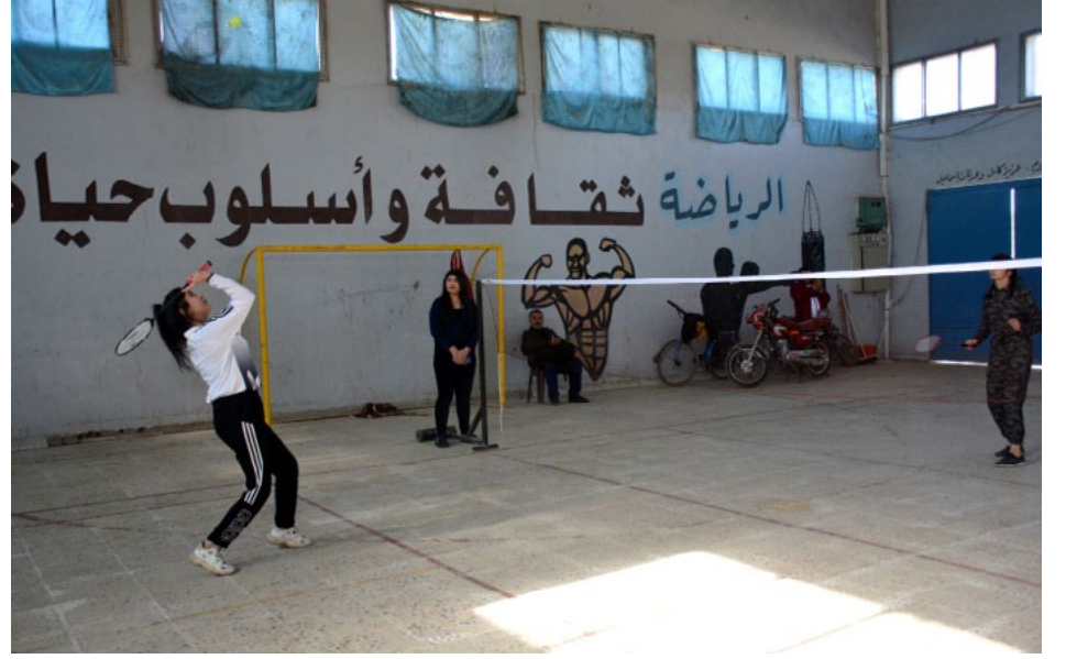
بطولته الأولى في بطولة السيدات في مدينة الطبقة