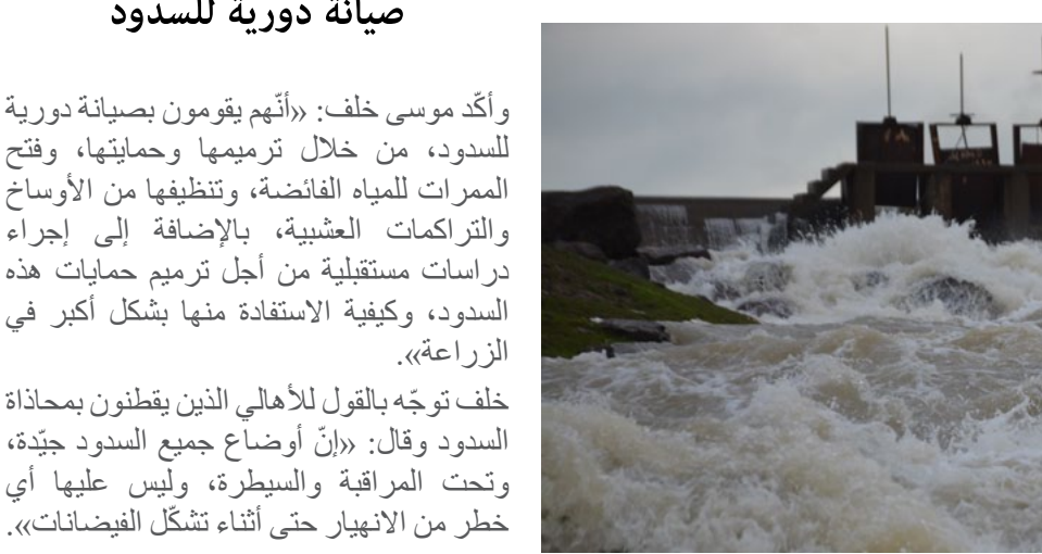
محجرة الصفحة – بيريفان حمي

أما سد جل آغا استطاعته ١٢ مليون متر مكعب من المياه ويوجد حالياً تسعة مليون متر مكعب، وسد ذخيرة (باب الحديد) استطاعته ٢٤ مليون متر مكعب، و يوجد فيه حالياً ١١ مليون، أما سد سفان (حياكة) استطاعته ٤٨ مليون متر مكعب، و حالياً يوجد فيه ٤٥ مليون متر مكعب فيها حالياً ١٧ مليون ونصف متر مكعب، بينما يخزّن سد مشقوق اثنين مليون متر مكعب من المياه، ويوجد فيها حالياً مليون و٣٠٠ ألف متر مكعب من المياه.