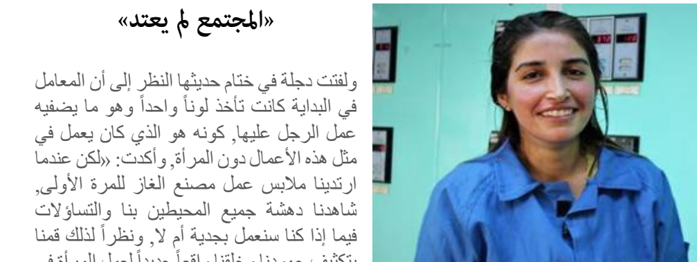
«المجتمع لم يعتد»