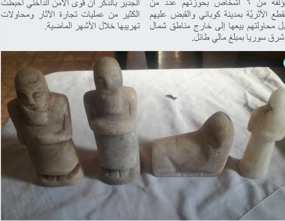
الأثرية في المنطقة.

استطاع قسم مكافحة الجريمة رصد مجموعة مؤلفة من ٦ أشخاص بجوزتهم عدد من القطع الأثرية بمدينة كوباني والقبض عليهم قبل محاولتهم بيعها إلى خارج مناطق شمال وشرق سوريا بمبلغ مالي طائل.