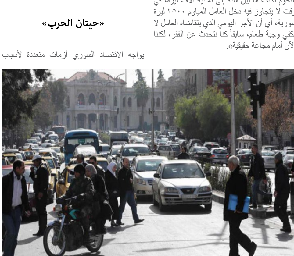
يواجه الاقتصاد السوري أزمتا متعددة لأسباب