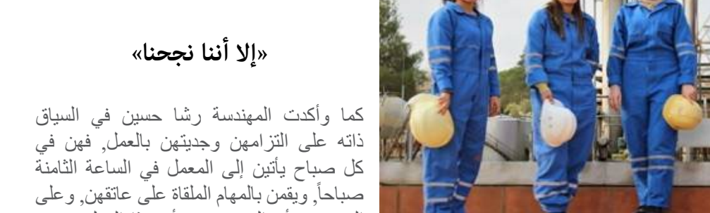
«إلا أننا نجحنا»