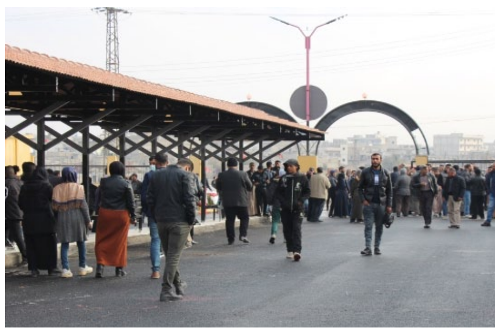
محجرة الصفحة – بيريفان حمي

والجدير بالذكر أنّ الكراج مزوّد بكافة المستلزمات والخدمات ليتناسب مع الكراجات الحديثة، من تأمين أماكن لاستراحة الركاب، وحمامات ومرشحات من التوتياء والقرميد للسيارات ومكاتب لاستراحة السائقين.