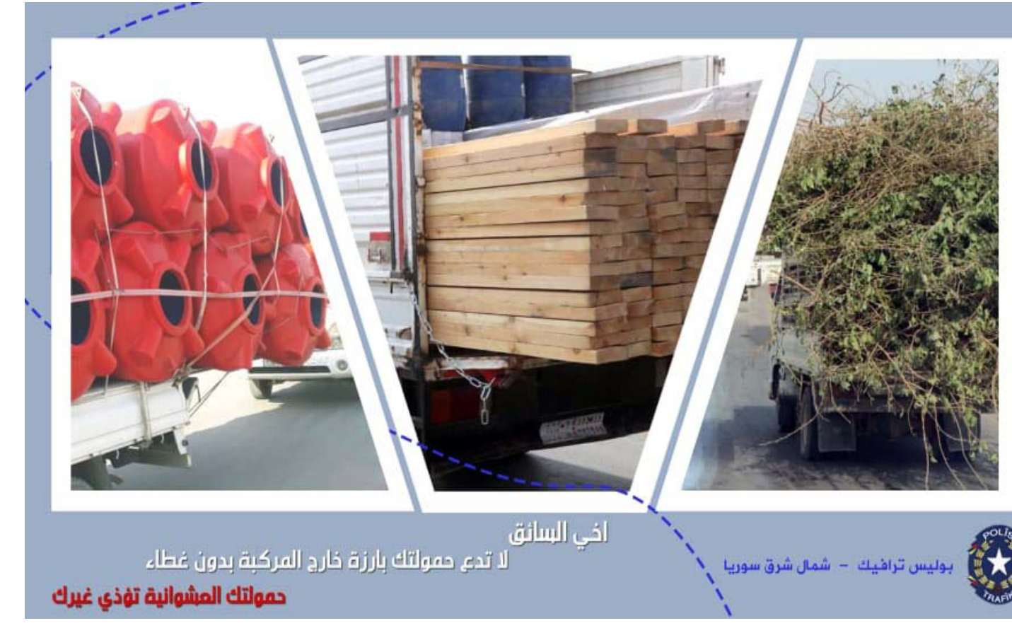
أخي السابق لا تدع حمولتك بارزة خارج المركبة بدون غطاء بوليس ترافيك - شمال شرق سوريا حمولتك المشاوية تؤذي غيرك