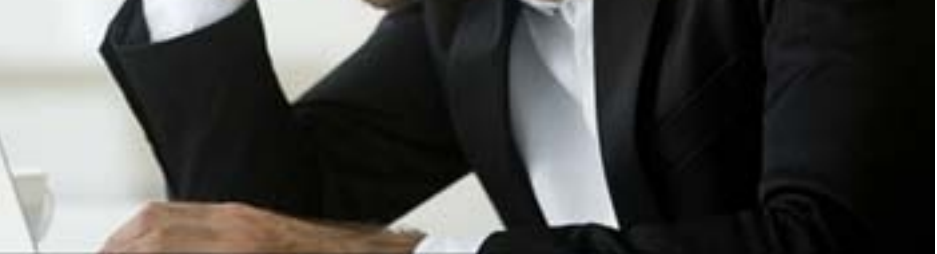
استنفاد الطاقة سبب الاستقالات

تبين أن حوالي ٥٩٪ من المشاركين في الدراسة يُلقون باللوم في هذا الشعور على العمل لساعات طويلة، مشيرين إلى أن الزيادة الملحوظة على عدد ساعات العمل طرأت بعدما اضطروا للعمل من منازلهم بسبب الإغلاق وحظر التجوال خلال مراحل احتدام جائحة كورونا. عمل بعض المشاركين في الدراسة لمدى ٥٩ ساعة إضافية في خمسة أشهر.