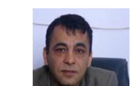
د.زهيم، الامتئاع عن التجمع في العيادات الطبية الخاصة والمشافي ودور التعزية، في إشارة منه إلى افتقار العالم للقاح العلاجي لمواجهة الفيروس وأنه لا يوجد له لقاح أفضل من الوقاية الذاتية في الوقت الحالي.

وتابع الطبيب الذي أصيب أيضا بهذا الفيروس، ويتابع تطورات انتشاره في المنطقة والعالم، حديثه بالفول أنه «مع دخولنا فصل الخريف المرفق ببعض البرد حتماً زاد من حجم المشكلة، هناك بشكل يومي أكبر ويحصد الأرواح يوميا لدرجة أصيب بها الكثير عشرات الإصابات بالإضافة إلى الوفيات. كورونا