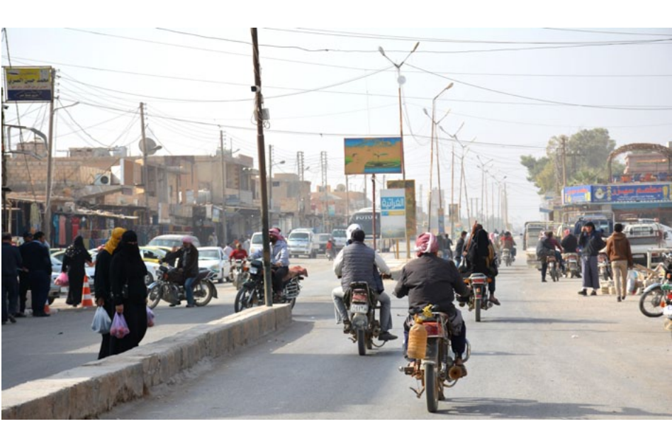
سواق في مدينة حلب، سوريا، ٢٠٢٠.

سعر الكمامة الطبية /٣٠٠/ ل.س وسعر المعقم /٨٠٠/ ليتر؛ وأسعارها تعتبر مناسبة نوعاً ما لأهالي، منوهاً إلى أن سعر الكمامة كان قد وصل في أوقات سابقة إلى /٨٠٠/ ليتر سورية.