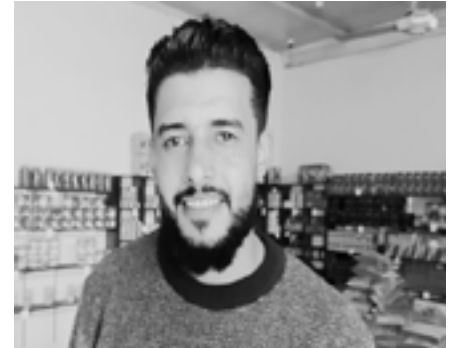
كانوا يتكلمون بأسعار السلع بحجة ارتفاع سعر