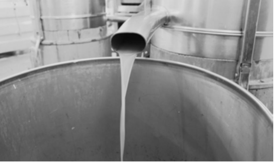
وأضاف أوسو: «تحتاج شجرة الزيتون إلى ري

الأكثر انتشاراً في منبج وريفها هو الزيتون «الزيتي والخلخالي والصوراني».