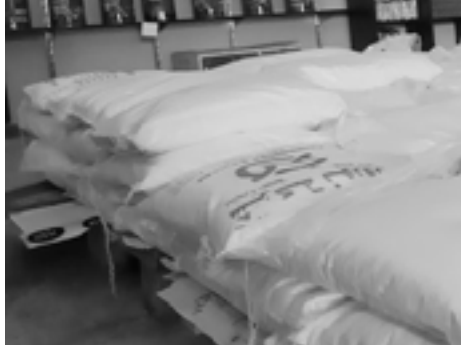
محبرة الصفحة - بيريغان حمصي

والمعامه، أي سنة يكون الحمل جيد وكثير والسنة الثانية يكون الحمل خفيف جداً. بينما