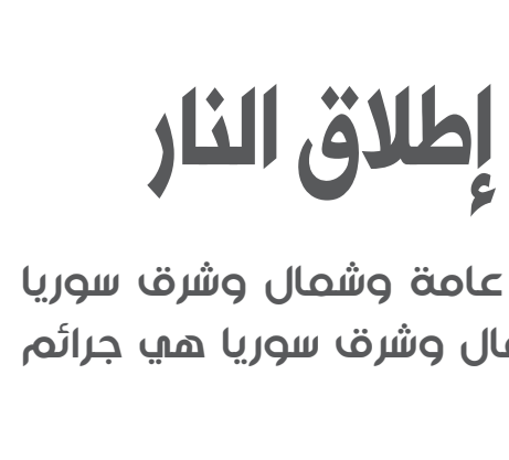
سيطرة وتحتلها، ويحدث ذلك بوجود مسؤولين

المضحايا المدنيين ودعهم لنيل العدالة وحقوقهم المنتهكة».