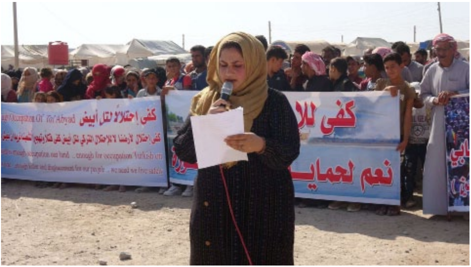
كفتى كفتى للاحتلال لقتل ايبيش نوياره في ريف حلب الشمالي

وتوقف المشاركون في التظاهرة أمام مركز المجمع التربوي في ناحية جل آغا، وهناك تحدث كل من عضو حزب الاتحاد الديمقراطي سوريا.