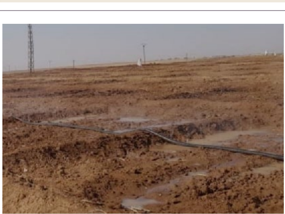
محررة الصفحة - بريفان حمي

والجدير ذكره أن المواد المصادرة ومنتية الصلاحية شملت كل من: العدس، القهوة، مسحوق الشراب، الشعورية - الحمص - الطحينية - والديس الطلو، حيث تم حرقها في مكب النفايات بمنطقة بر كفري بهدف الحفاظ على السلامة العامة.