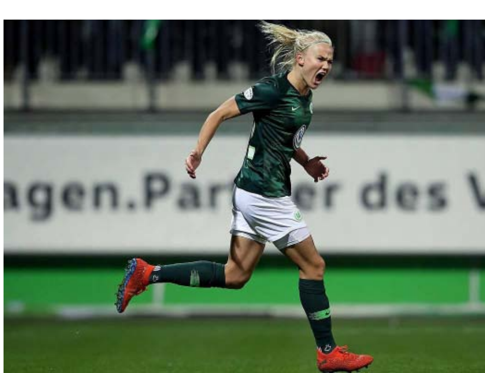
لاعبة كرة قدم ألمانية

لقت نظري قبل أيام خبر اختارت فيه مجلة «كيكر» الألمانية المتخصصة في شؤون كرة القدم، روبرت فيلاندوفسكي، مهاجم بايرن ميونخ، للقب لاعب العام ٢٠٢٠؛ بحسب