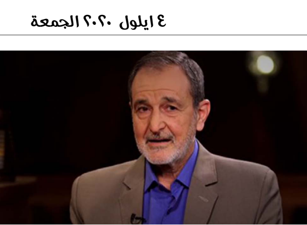
٤ ايلول ٢٠٢٠ الجمعة