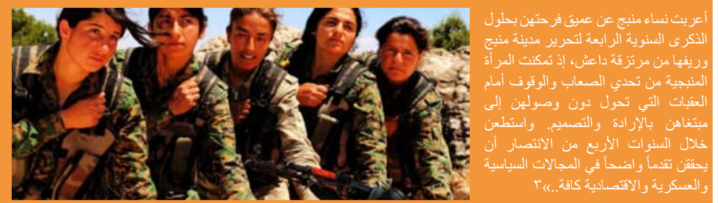
أعربت نساء منبج عن عميق فرحتهن بحلول الذكرى السنوية الرابعة لتحرير مدينة منبج وريفها من مرتزقة داعش، إذ تمكنت المرأة المنبجية من تحدي الصعاب والوقوف أمام العقبات التي تحول دون وصولهن إلى ميثاقين بالإرادة والتصميم. واستطعن خلال السنوات الأربع من الانتصار أن يحققن تقدماً واضحاً في المجالات السياسية والعسكرية والاقتصادية كافة...»؛

يبدل عمال النظافة جهوداً كثيفة في التعقيم للحفاظ على سلامة المواطنين في المنطقة، ويقع على عاتقهم العبء الأكبر في وقاية وسلامة المواطنين وحمايتهم من فيروس كورونا، إنهم جنود مجهولون في مواجهة كورونا.