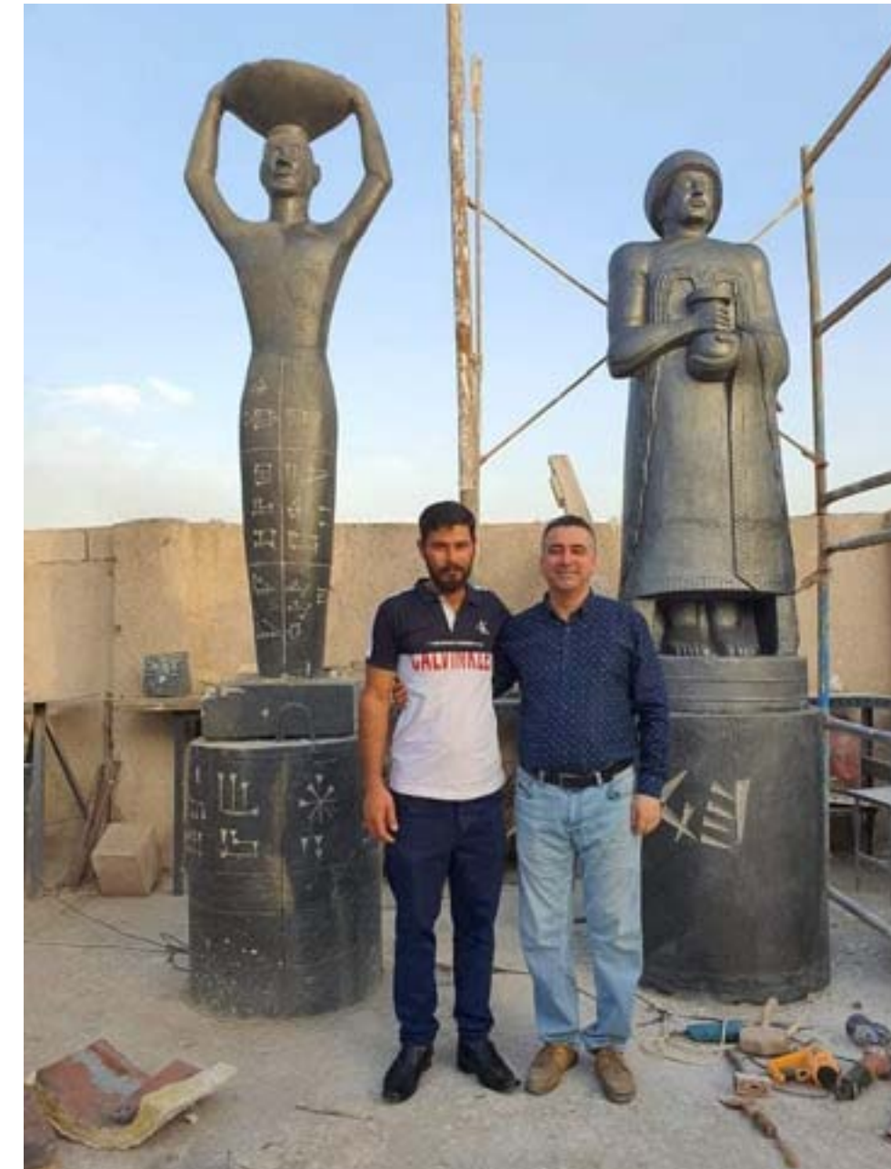
في إعادة إنشاء تماثيل اثنين من ملوك بلاد ما بين النهرين القدامى، هما أورنامو وكرديا. وقال مدير المتحف إن ارتفاع كل تماثيل منهما يبلغ ثلاثة أمتار ونصف المتر، وسيتم وضعهما على جانبي بوابة المتحف.

قرر سائق شاحنة عراقي التخلي عن عجلة القيادة بعد سنوات من العمل ليتهجه إلى أدوات النحت مُليياً نداء حبه الشديد بذلك النوع من الفن.