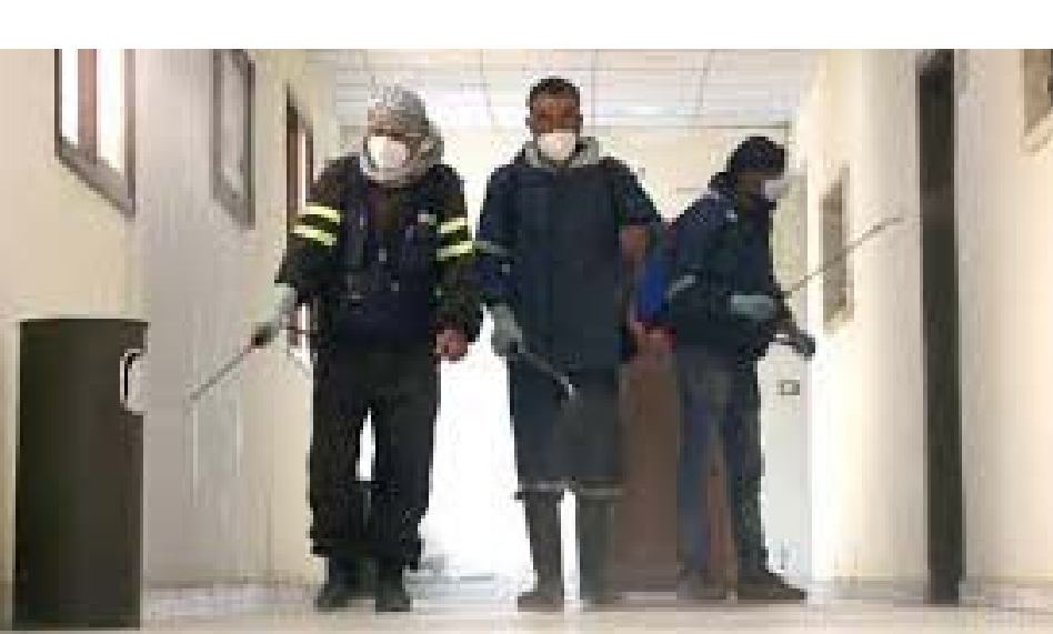
طاقم طبي في مستشفى في مدينة حلب، سوريا.

يوماً بعد يوم تتزايد حالات الإصابة المؤكدة بفيروس كورونا المستجد في سوريا عامة، مع احتفاظ نسبة الوفيات بمعدلات ثابتة وأقل من معدل الوفيات في الدول الأوروبية والصين إبان ظهور الفيروس في بداياته، لكن في الوقت ذاته حذرت تقارير غربية من كارثة إنسانية في سوريا عامة، نتيجة تزايد حالات الإصابة وضعف الإمكانيات الطبية وبمعتب آخر قرب انهيار القطاع الصحي ولا سيما في مناطق الحكومة السورية.