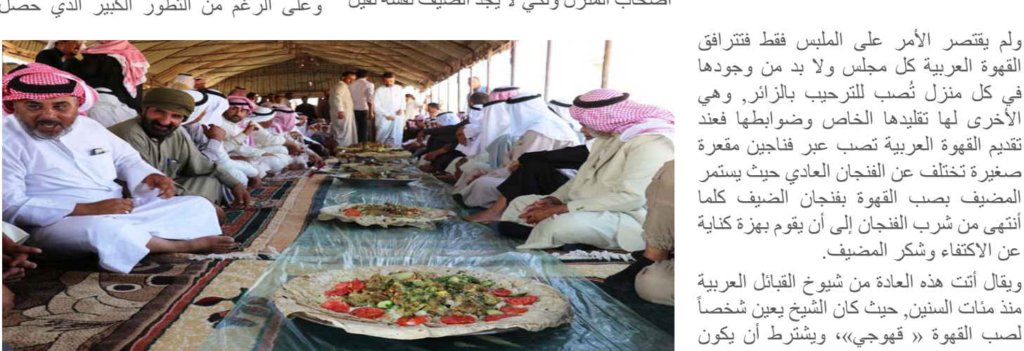
حفل عشاء في مدينةالبحرين، حيث يجلس الضيف على مائدة طويلة مع المضيفين.

تمتلك الشعوب العربية ثوابت في بعض المفاهيم فجد أن إكرام الضيف سمة خاصة تميز الشخص العربي عن غيره، فعند حضور ضيف ما تدبج الذبائح وتقام الولائم على شرفه، ولا يتم سؤاله إلا بعد مضى ثلاثة أيام من ضيافته، حيث يوجد في كل بيت غرفة خارجية معزولة عن المنزل تسمى «الديوان» خاصة بالضيوف مخدمة من كل شيء، ويكون الديوان معزولاً لكي لا يجرح الضيف من أصحاب المنزل ولكي لا يجد الضيف نفسة ثقيل