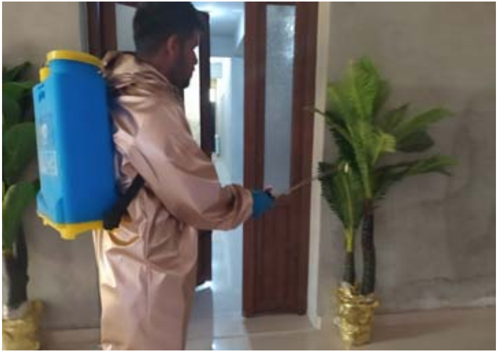
رجل يرش مبيدات الحشرات في إحدى مناطق شمال وشرق سوريا، حيث تعدّ مكافحة الحشرات من أهمّ المهام التي تضطلع بها الجهات المختصة في المحافظة على سلامة المواطنين.

وقد سجلت في فترة الأسبوع الفائت مناطق شمال وشرق سوريا أعدادًا كثيرة للإصابات