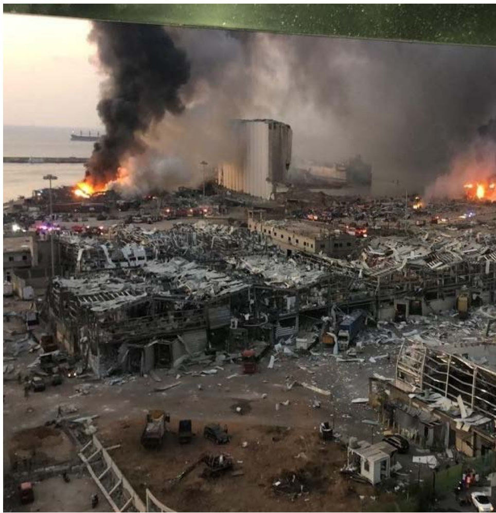
بيروت في ١٩٧٦، بعد حروب الطوائف التي مزقت شمل الشعب اللبناني

أرادوا النيل من الشعوب المقاومة والمحبة للحياة، التي لا تعرف معنى الموت والاستسلام والخنوع، يحاولون النيل من هذه المجتمعات لأنها كانت دائماً مصدراً للأمل ومقاومة الاستبداديين والسلطويين الذين يرون وجودهم