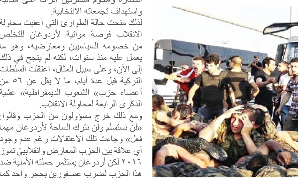
من العام ٢٠١٦.

من العام ٢٠١٦. لقد مرز أربع سنوات على تلك المحاولة الانقلابية الفاشلة ولم يُعرف إلى الآن من كان يقف وراءها، رغم أن عشرات الآلاف اعتقلوا إثر اتهامهم من قبل السلطات التركية بالتورط في المشاركة بتنفيذها، إلا أن الملفت طيلة تلك الفترة أن الاعتقالات لم تقتصر على أعضاء «الشعب الديمقراطية»، والتعددي وعناصر من الجيش والشرطة وآخرين، اتهموا بالعضوية في جماعة «الخمسة»، التي يقودها الداعية التركية فتح الله غولن المتهم بالوقوف وراء حركة الانقلاب «الشعب الديمقراطية»؟