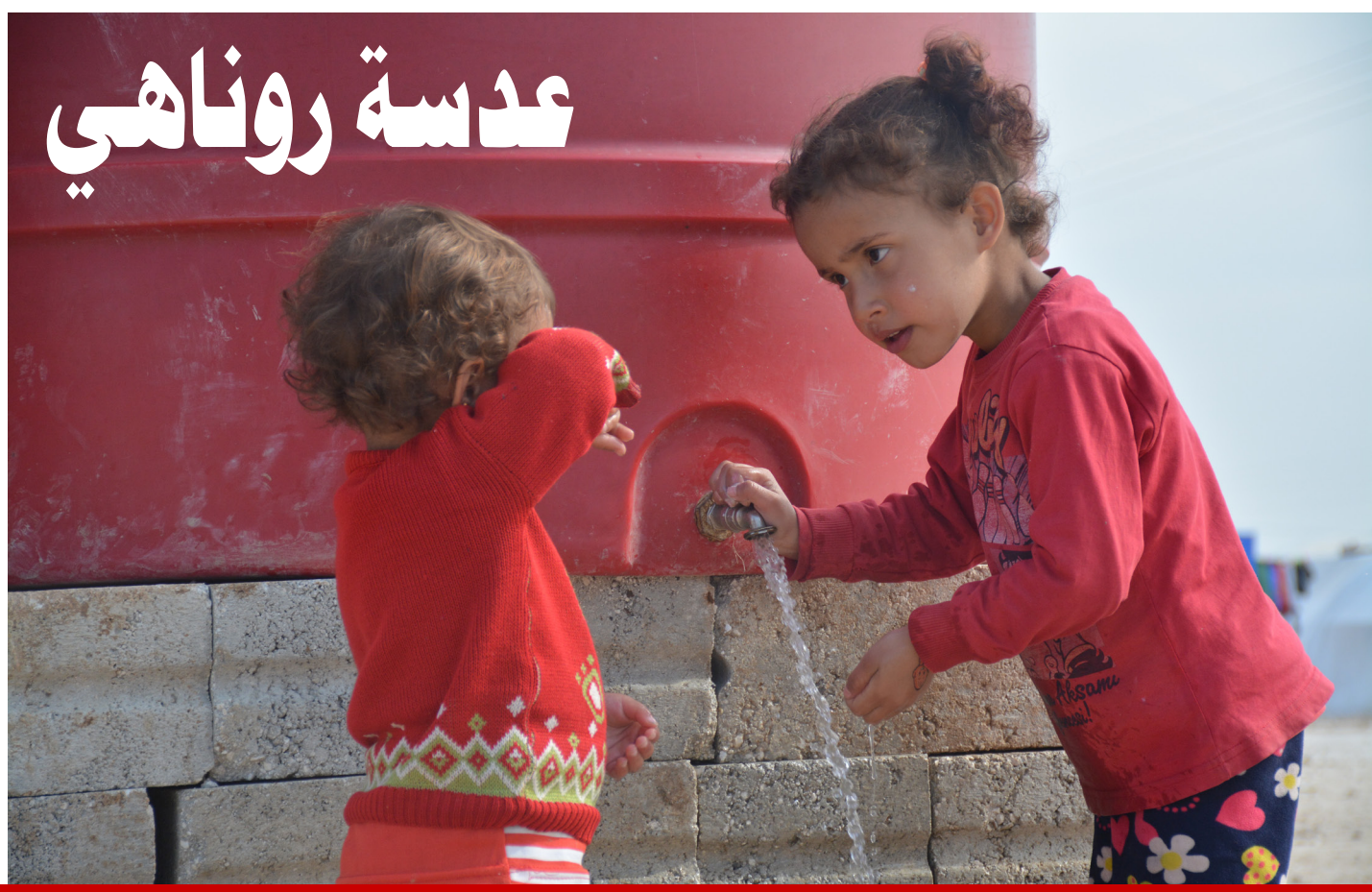
صور أطفال مخيم واشو كاني بعدسة نشيتمان ماردنلي

حبيها الكبير للقراءة ساعدها في تنمية موهبتها في فن الكتابة فقد أحببت القراءة كثيراً حيث تقرا بشكل مكثف الكتب السياسية والثقافية ومرافعات القائد عبدالله أوجلان، بالإضافة للروايات حتى يكون لديها مخزون من الكلمات، فالطريق الأساسي حتى تكون كاتبة جيداً هو القراءة