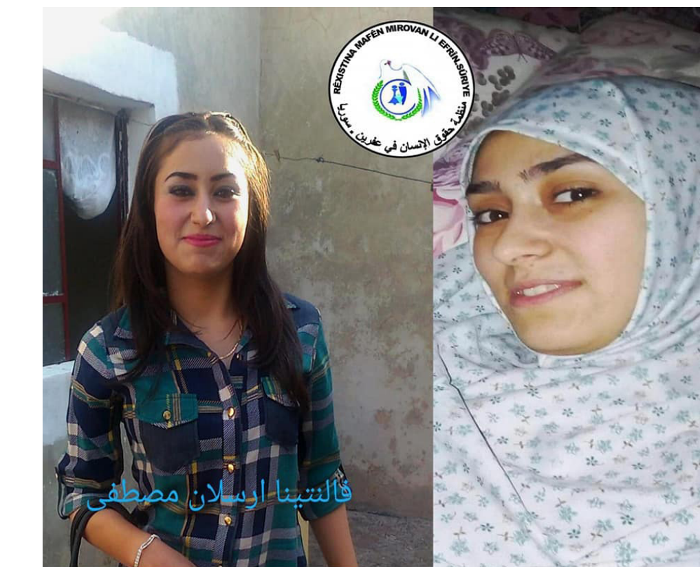
فالتفتنا بعد الاختطاف