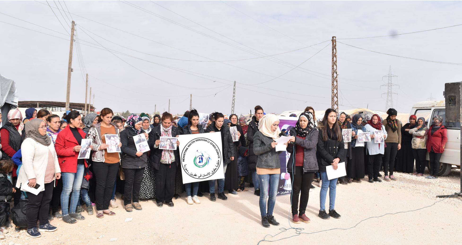
تقرير/ صلاح ابيو

نشرت منظمات حقوقية مقطع فيديو لأم تُطالب بالكشف عن مصير ابنتها المختفية منذ سنة وأكثر، فالتفتنا التي اخفتت العام الماضي في عفرين بعد توجهها لأحد مقرات مرتزقة الاحتلال التركي بهدف زيارة زوجها المختطف هناك، والتي تعرضت للإبتزاز والاستغلال الجنسي والجسدي وقتها، والقيت بعد أيام في حديقة عامة بمدينة عفرين، اليوم مصيرها مجهول بعد إرغامهم للذهاب إلى إلب، الأم تجدد مناشدتها للمنظمات الدولية لكشف مصير ابنتها فالتفتنا، لكن بعد عام من تلك الحادثة التي لم تحرك ساكنًا؛ وقتها شهدت مدينة عفرين المحنته انتهاكات جمة بحق النساء وكبار السن والأطفال، ولعل ما كُتف من مطومات خلال الأيام القليلة الماضية عن وضع النساء المعتلات والمختطفات في سجون مرتزقة (فصيل الحمزات) سلط الضوء أكثر على مدى تنكث معايير حقوق الإنسان في المناطق الخاضعة للاحتلال التركي بسوريا.