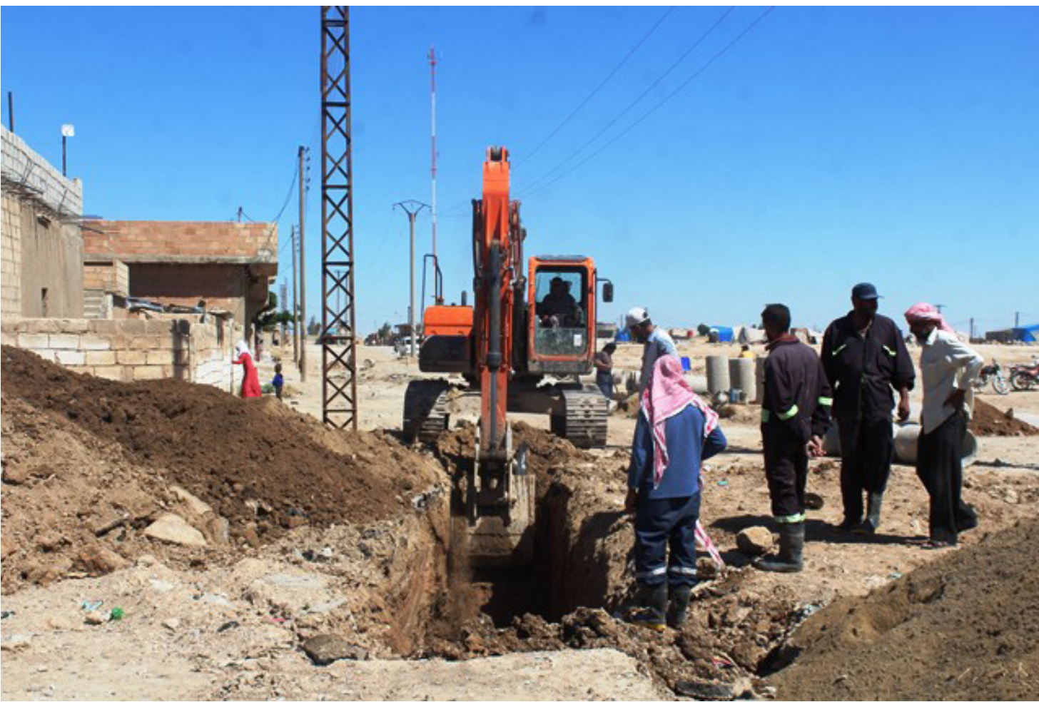
عمال البلدية يعملون على تركيب مشروع بطول أربعة كيلو مترات حسب الإمكانيات المتوفرة لديها، لتلبية لشكاوى الأهالي. يعاني أهالي ناحية الشدادي من تشكل بعض المستنقعات والتبعث روائح كريهة في عدة أحياء من الناحية، نتيجة تسرب مياه مجاري الصرف الصحي، بسبب اهترانها، حيث سلطت وكالة أنباء هوار الضوء على هذه المشكلة بأحد آراء المواطنين والمعنيين بهذا الشأن.

وأردفت: «بعد أن هربت من المنزل بسبب التعنيف الجسدي الذي تعرضت له، تعرّفت كغيرها من الإطواهر الإجتماعية السلبية التي ازدادت عمقاً ورسوخاً خلال سنوات الحرب في سوريا لدرجة وصل فيها الأمر ببعض الشباب والمراهقين إلى تعاطي مادة «الحشيش»، المخدرة في الحدائق العامة.»