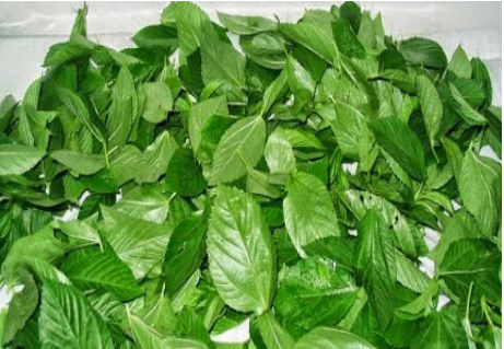
رجل يغتسل بالماء البارد.