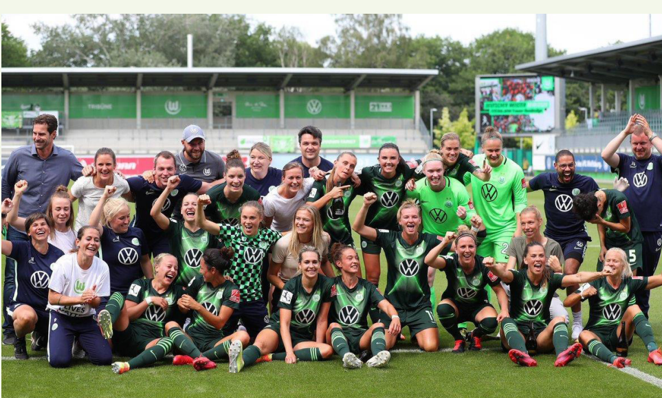
محرر الصفحة - جوان محمد

وأحكم فولفسبورغ قبضته على الصدارة، بعدما رفع رصيده إلى ٥٨ نقطة، ليحسم فوزه رسمياً سدهاء للغاية، لأننا تخمنا البطولة متكرراً. لكنه بالبطولة، بعدما حافظ على فارق ٨ نقاط بفضله عن أقرب ملاحيه بايرن ميونخ.