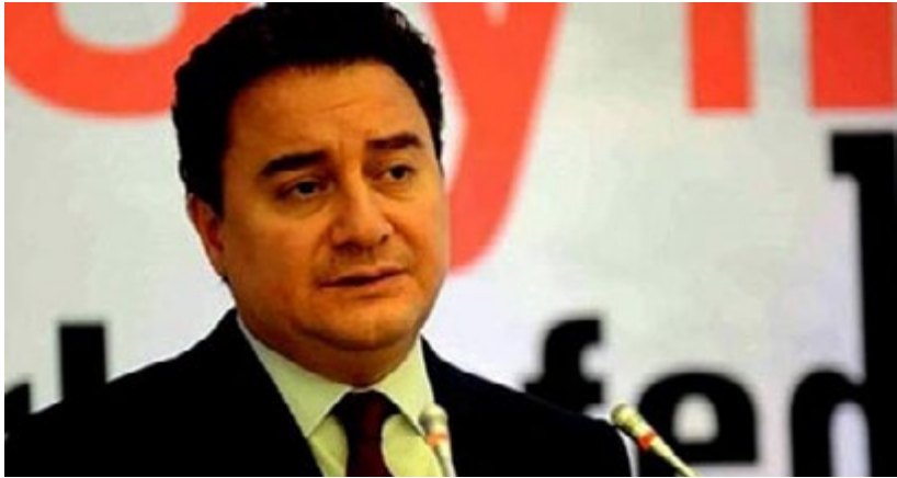
وزير الخارجية التركي السابق، محمد إردوغان، يتحدث في مؤتمر صحفي في أنقرة، ٢٠1٤.