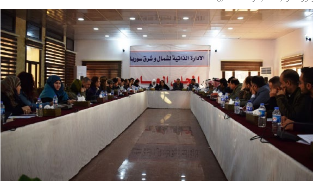
محرر الصفحة -رفيق إبراهيم

وأكد أحمي بأن قانون قيصر لن يشمل مناطق الإدارة الذاتية قائلا: «توجد مادة في قانون قيصر، تقول بأن العقوبات تشمل المناطق التي تحت سيطرة النظام فقط،