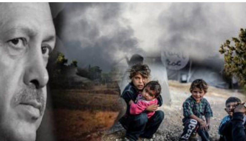
محرر الصفحة -رفيق إبراهيم

«ليس سوريا فقط فإن أي دولة عانت من حرب مستمرة لعشر سنوات ستحتاج لوقت طويل قبل المباشرة بهذه الخطط لتنظيف العقول، وكل ما يمكن القيام به حالياً التعجيل بإنهاء الوضع خلافة ومرترقة.