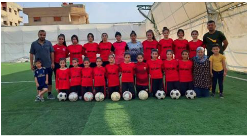
سيدات قامشلو في بطولة الدوري لعام ٢٠١٧

سيدات قامشلو بطلات الدوري لعام ٢٠١٧ - ٢٠١٨، والكأس لعامي ٢٠١٨ - ٢٠١٩، بينما انسحبن من دوري العام ٢٠١٩، بعد الانتهاء من مرحلة الذهاب وتصدرن المرحلة بمجموعتهن وقتها، وعزّت إدارة النادي ذلك لأسباب عديدة أهمها المالية،