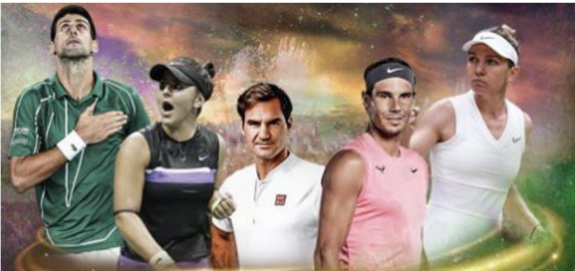
محرر الصفحة - جوان محمد

عقب انتهاء هاتين البطولتين، تتجه الأنظار إلى بطولة أميركا المفتوحة المقرّر إقامتها بين أواخر شهر آب وأول أسبوعين من