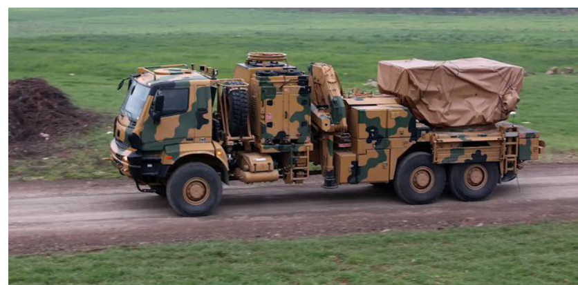
الإنسان، أمس (السبت) ٢٥ نيسان أن رتل معبر كفر لوسين شمال إدلب. وأضاف عسكري لجيش الاحتلال التركي دخل من المرصد أن الرتل يتألف من ٢٠ آلية عسكرية،

مركز الأخبار - في مسعى منها لترسيخ احتلالها للأراضي السورية وإعادة أمجاد سلطنتها العثمانية البائدة؛ تستمر دولة الاحتلال التركي بممارسة سياستها التعسفية في سوريا من خلال إرسال المعدات العسكرية والمرتقة إلى المناطق السورية المختلفة، فأدخلت مؤخراً أسلحة ثقيلة إلى إدلب؛ بهدف الاستمرار في التصعيد..