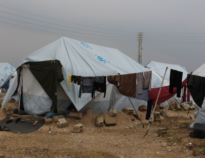
مخيم للاجئين السوريين في شمال سوريا.

وبهذا الخصوص كانت لصحيفتنا زيارة إلى مخيم