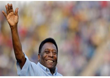
محمر الصفحة - جوان محمد

وقال بيليه «سانتوس هو أكثر المروجين للبرازيل. يحيا سانتوس، أشكر الذين دعموا النادي باستمرار والجماهير التي تعشق الفريق حتى الآن».