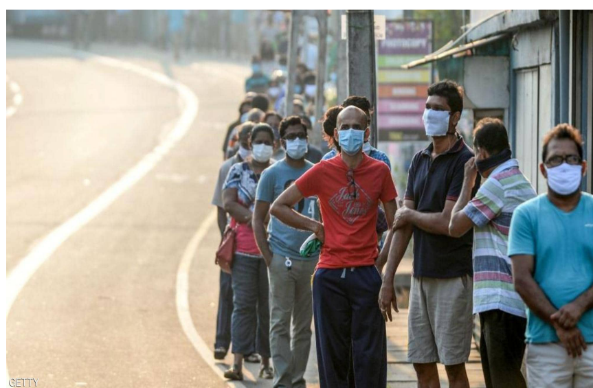
الولايات المتحدة هي الأكثر عالمياً للإصابات بفيروس كورونا

- وزير الصحة الكويتي: تسجيل ٦٢ حالة شفاء من فيروس كورونا ليرتفع عدد حالات التعافي إلى ٣٦٧.