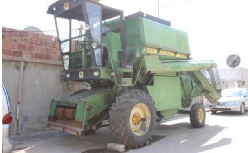
مزارع في محافظة حلب