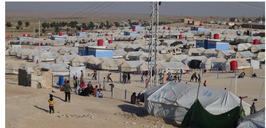
مركز الأخبار - في ظلّ جائحة كورونا، تعاني

النساء النازحات من العنف من قبل الذهنية الذكورية، وهذا ما أكدته مساعدة المفوض السامي لشؤون اللاجئين جيليان تريغز والتي شددت على ضرورة إيلاء اهتمام عاجل لحماية النساء النازحات من العنف، مع ضمان أخذ معالجة أخطار العنف المتزايدة