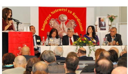
مركز الأخبار - وجه المؤتمر الوطني الكردستاني KNK رسالة مفتوحة إلى قادة القوى الكردية تخص قضية زينه ورتي، داعياً جميع القوات الكردية لوضع خلافاتها جانباً وتوحيد صفوفهم.

الوطني الكردستاني KNK زينب مراد وأحمد كاراموس رسالة مفتوحة إلى رئيس إقليم كردستان نجبيرفان بارزاني، ورئيس وزراء إقليم كردستان مسرور بارزاني، ورئيس الحزب الديمقراطي الكردستاني (PDK) مسعود بارزاني، والرئيسان المشتركان للاتحاد الوطني الكردستاني(YNK)، لاهور شيخجنكي وبافل طالباني والرئيسان المشتركان لمنظومة المجتمع الكردستاني(KCK) بسي هوزات وجميل بابك. وتضمنت الرسالة: «قبل أيام قليلة، كان هناك اشتباك خطير بين قوات الحزب الديمقراطي الكردستاني PDK والاتحاد الوطني الكردستاني YNK