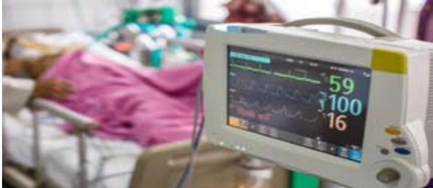
جهاز التنفس الصناعي في مستشفى في ولاية كاليفورنيا

في بعض الحالات الخطيرة أو طويلة المدى، يتم توصيل أنبوب التنفس مباشرة بالقصبة الهوائية من خلال ثقب صغير في الرقبة يتم فتحه بعملية جراحية. ويستخدم جهاز التنفس الصناعي الضغط لدفع الهواء المؤكسج في الرئتين. ويحتاج جهاز التنفس الصناعي إلى الكهرباء للتشغيل، ويمكن أن يعمل بعض الأنواع على البطارية.