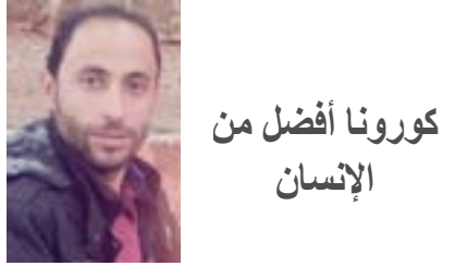
كورونا أفضل من الإنسان