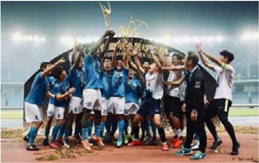
محرر الصفحة - جوان محمد

أصبحت تايوان خامس بلد في العالم تقام فيه بطولة دوري كرة القدم، عقب سماح الحكومة بإقامة المباريات في ظل نقشي فيروس كورونا المستجد. وبدأت المنافسات بدوري كرة القدم النسائية السبت والدوري الممتاز الأحد.