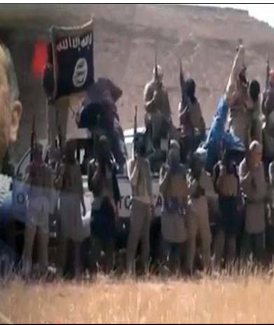
محرر الصفحة - رفيق ابراهيم

لها من نفس هذه المنصات التي احتفت بمرمز التطرف، لأنه رفض تصعيد اردوغان وانتقد صورته والتناء بالمبالغ في حقّه. كما وقعت وكالة الأناضول على خطأ يكشف حجم التنسيق مع الظهير القطري في الإطار