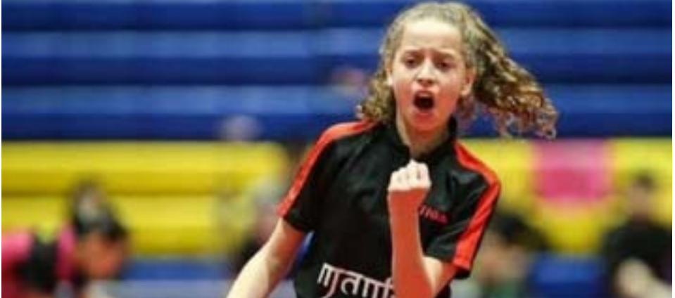
أعلن الاتحاد الدولي لتنس الطاولة، التصنيف العالمي الجديد لمختلف المراحل السنية.