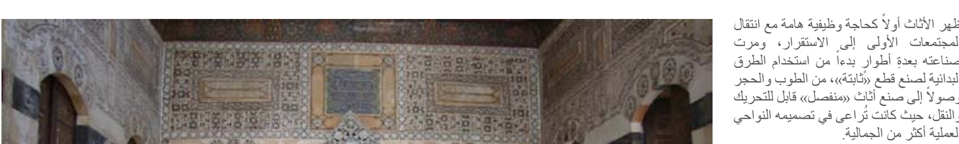
الأثاث الدمشقي، من تصميم المهندس المعماري السوري، محمد علي حيدر، في متحف البيت الدمشقي، دمشق، سوريا.

يعد تصميم الأثاث نموذجاً مصغراً عن التصميم المعماري بشكل عام. فكلاهما يحمل المفاهيم نفسها من زاوية ونطاق مختلفين، وكلاهما يشمل التعامل مع التفاعلات البشرية، فالأشخاص يتفاعلون مع المبانى بالطريقة نفسها التي يتفاعلون فيها مع الأثاث، مع الأخذ في الاعتبار اختلاف مستوى هذا التفاعل تبعاً للوظيفة.