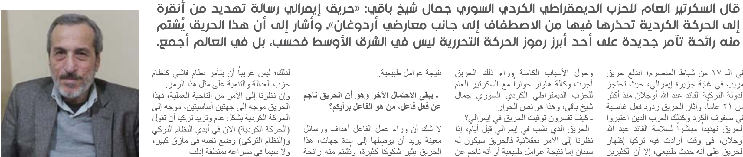
جمال شيخ باقي، قائد حركة تحرير سوريا، في زيارة لبلدية حلب، ٢٠١٤

لذلك؛ ليس غريباً أن يتأمر نظام فاشي كظام حزب العدالة والتنمية على مثل هذا الرمز. وإن نظرنا إلى الأمر من الناحية العملية، فهذا الحريق موجه إلى جثتين أساسيتين، موجه إلى الحركة الكردية بشكل عام وتريد تركيا أن تقول (الحركة الكردية) الآن في أيدي الفظالم التركي (والنظام التركي) وضع نفسه في مأزق كبير، ولا سيما في صراعه بمنطقة ادلب. وترتكبا تحاول أن تحذر من الدخول في توازنات ادلب وفي صراع مع النظام هناك، فتحاول أن تقول نحن هنا نستطيع أن نقدم على خطوة كبيرة جداً، هذا من ناحية وأيضاً موجهة إلى القوى التحررية الكردية في باكور كردستان، وهي تحذر وتقول لا تتحرروا وراء المعارضة التركية المتصاعدة وبالتالي تصبح التوازنات صعبة بالنسبة لأردوغان في الداخل التركي.