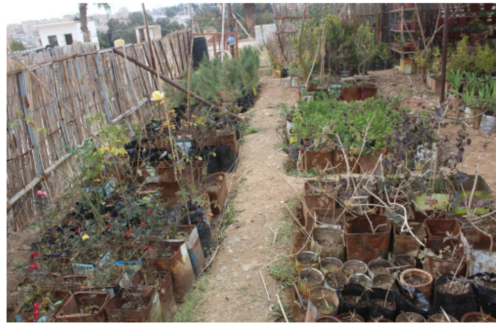
تجهيز الفراس في المشتل والتي وصل عددها إلى أكثر من ثلاثين ألف غرسة وهي متنوعة فمنها الأشجار الحراجية وأخرى المثمرة إضافة إلى نباتات الزينة.