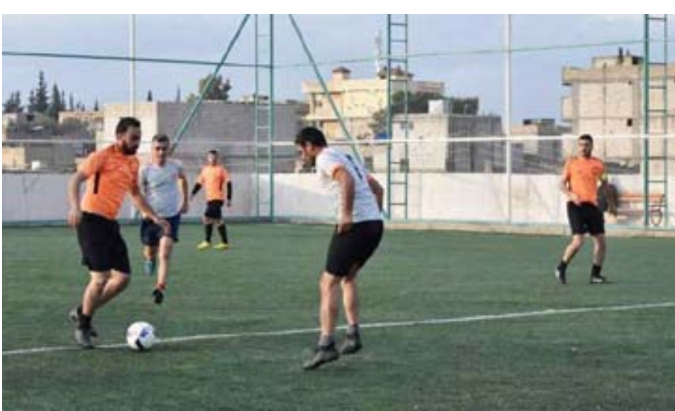
روناهي / قامشلو

- انطلقت منافسات دوري الفاشنين لكرة القدم