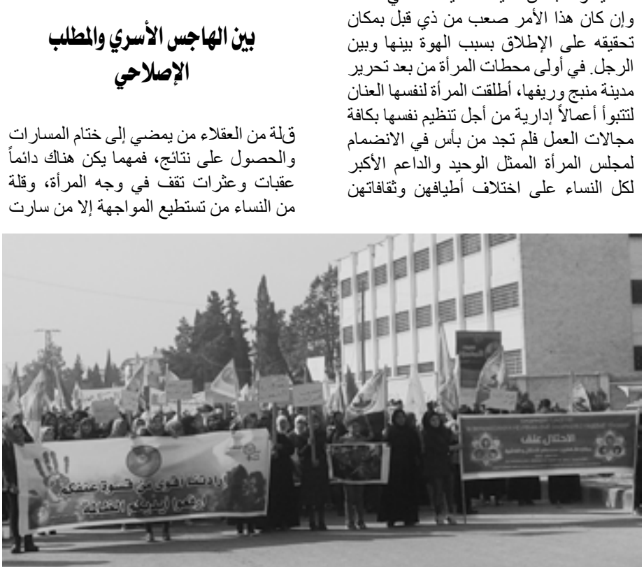
قبة من العقلاء من بعضى إلى ختام المسارات والحصول على نتائج، فمهما يكن هناك دائماً عقبات وعثرات تقف في وجه المرأة، وقلة من النساء من تستطيع المواجهة إلا ما سارت

أولى الخطوات المدروسة من بعد مأسسة الإدارة المدنية الديمقراطية في مدينة منبج وريفيها، كان الالتفات إلى المرأة ككائن إنساني مثلهما مثل الرجل، وهذا يعني أن لها الحق بشكل عام في الانخراط في العمل بالمؤسسات المدنية والمجالس تمثيلاً صحيحاً مئة في المئة، وإن كان هذا الأمر صعب من ذي قبل بمكان تحقيقه على الإطلاق بسبب الهوة بينها وبين الرجل. في أولى محطات المرأة من بعد تحرير مدينة منبج وريفيها، أطلقت المرأة لنفسها العنان لتنتوي أعمالاً إدارية من أجل تنظيم نفسها بكافة مجالات العمل فلم تجد من بأس في الانضمام لمجلس المرأة الممثل الوحيد والداعم الأكبر لكل النساء على اختلاف أطبقهن وثقافتهن من النساء من تستطيع المواجهة إلا ما سارت