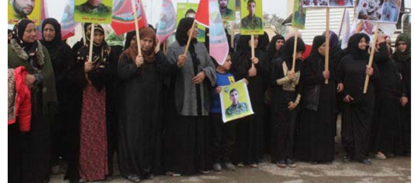
محرة الصنحة/مبيديا غانم

وفي هذا الإطار كان صحيفة روناها عدة لقاءات عبرت عن رفض الشعوب لبقاء أردوغان ضمن الأراضي في شمال وشرق سوريا، وأعمال دولة الاحتلال التركي التي تعبر عن ضرب وحدة شعوب المنطقة من خلال الخطوات الإجرامية وارتكاب المجازر والإبادة بحق الأطفال والنساء الأبرياء، وأشارت الكلمات إلى تصدي قوات سوريا الديمقراطية للعدوان وصمود أبناء شمال وشرق سوريا في