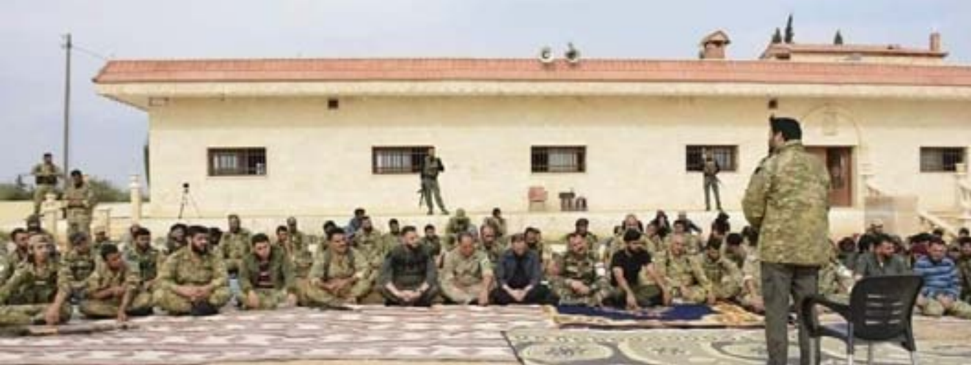
أحد أعمال المصنفة هايسان أحمد.

كما قابلت هيومن رايتس ووتش أيضاً، بين ٦ و١٦ نوفمبر/تشرين الثاني، خمسة