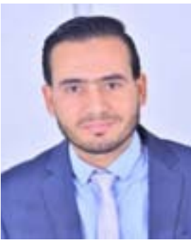
محسن عوض الله/صدي سيا

وظنه وهم الكرد، حيث يطالب بإبادة مَشيداً بما ارتكبه الرئيس العراقي السابق صدام حسين من جرائم بحقهم ويثني على ذلك. الزعبي الذي سبق وتولّى رئاسة وفد المعارضة التورّيّة في جنيف تحدّث للسان الكراهية، وبمنطق العنصريّة، ونظريّة الإقصاء، ضدّ من يحملون فكر المحبّة والأمة الديمقراطيّة وأخوّة الشعوب، ويدعون للتعاون والتكامل بين الجميع بغضّ النظر عن دينهم أو قوميتهم وأصلهم ولعتمهم. لم أهتم كثيراً بتلك الكلمات المسمومة والتي تعزّر عن فكر قائلها أو على أقصى تقدير تعزّر عن توجهات الكيان السياسيّ التي ينتمي له دون أن تكون تعبيراً عن حالة أو نظرة عربيّة عامّة تجاه الشعب الكرديّ. فالزعبي الذي لم يسمع عنه أحد شيئاً من فترة طويلة، ربّما أراد من تلك