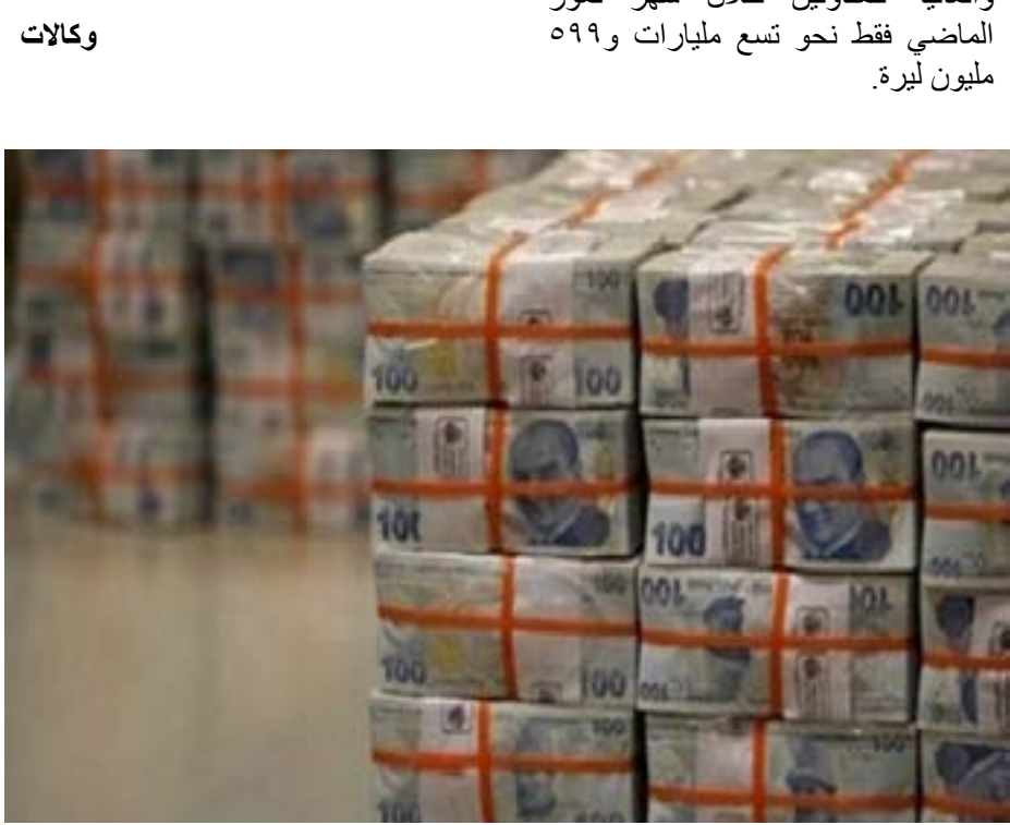
محررة الصفحة/بيرفان حجي

وبلغت قيمة مدفوعات وزارة الخزانة والمالية للمقاولين خلال شهر تموز الماضي فقط نحو تسع مليارات و٥٩٩ مليون ليرة.