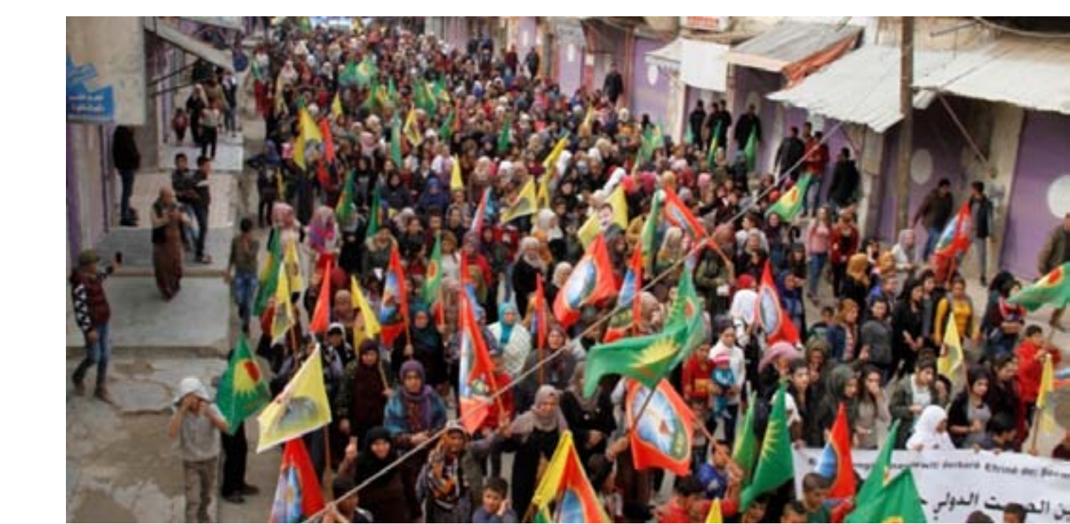
من الحدث الدولي

والتي بها يُظهر وجوده، والدفاع من أجل هذه القيم والمبادئ يعتبر حقاً ومشروعاً لذلك فهو مقدس، ومن دونه فإن موضوع الحياة والهوية سوف يكون على المحك . والشعوب عبر التاريخ كانت دائماً في وجه الظلّةا والظالمين والمستعمرن الذين يهدفون إلى النهب والقتل والصحر والإبادة للهوية والقيم .