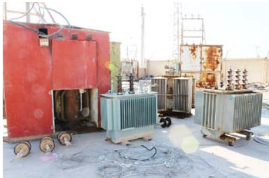
منطقة الأحياء والقرى القريبة من مدينة الطبقة، لإيصال التيار الكهربائي لكافة المنازل».

رواهي/ الطبقة – انتهت لجنة الاقتصاد في الإدارة المدنية الديمقراطية لمنطقة الطبقة من تنفيذ المرحلة الأولى لمشروع تنوير الطبقة، وفي الأيام المقبلة ستقوم اللجنة بإطلاق المرحلة الثانية التي تشمل منطقة الأحياء والقرى القريبة من المدينة.