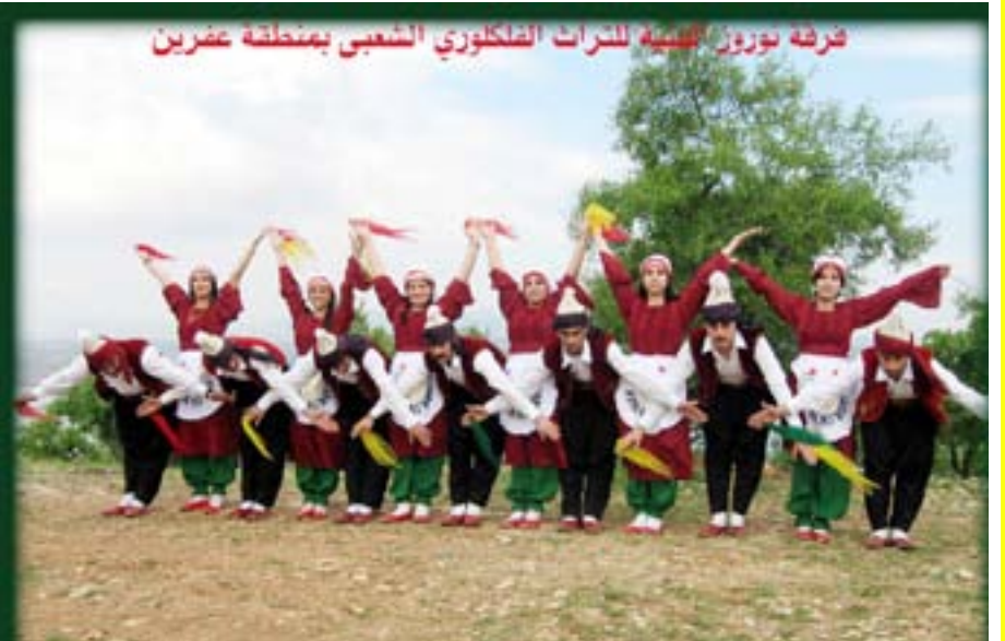
فرقة نوروز التيسيم للتراث الملطوري السعيمي بمنطقة عفرين