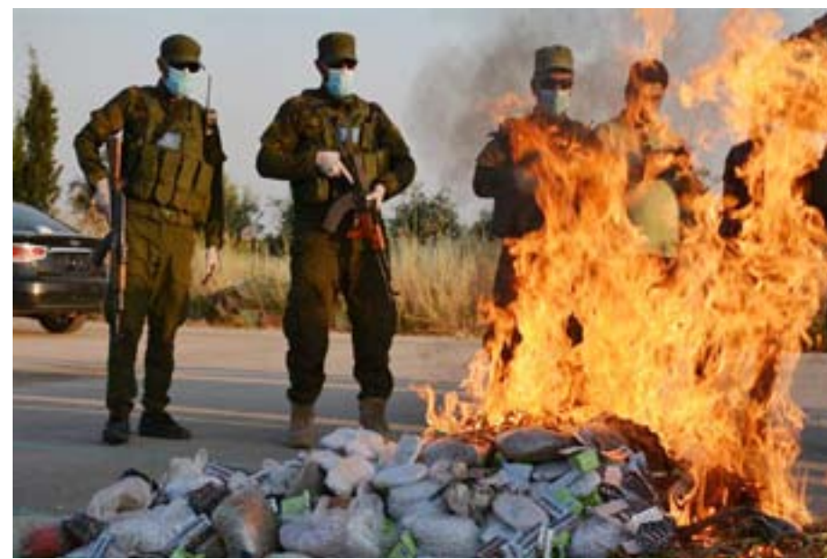
تقرير / آدار آمد .دلال جان

وأعضاء مكافحة الجريمة المنظمة في إقليم الجزيرة». وأضاف قائلاً: «بناءً على هذا نبين لكم إحصائية المواد المضبوطة من الحشيش والحبوب ومواد المخدرات من تاريخ ٢٦ حزيران ٢٠١٨ إلى ٢٥ حزيران ٢٠١٩ وهي كالتالي: الحشيش: حيث تم ضبط ثلاثة وتسعين ألفاً وستمئة وأربعة وثمانين غراماً وثلاثة أرباع الغرام من مادة المعجون وثبات القنب الهندي والقنب وأنواع أخرى وهي جاف مفروم وقش وحجري وبايس، إضافة إلى ٥ تفتلات من نوع قنبر و٧ سجائر معجون.