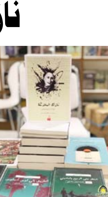
نازك الملائكة في إحدى جولاتها الأدبية

نازك الملائكة واحدةٌ من أهم الشعراء العراقيين والعرب، اشتهرت بأنها رائدة الشعر الحر أو (شعر التفعيلة)، حيث حققت انتقالاً كبيراً في شكل القصائد الشعرية وتركيبتها من الشكل والنظم الكلاسيكي الذي ساد في الأدب العربي لقرون عدة إلى الشكل المعروف بالشعر الحر، لم تولد الملائكة في بيئة بعيدة عن الشعر، إذ إنها نشأت في عائلة موهلة بالكتابة والأدب، ففي ٢٣ أغسطس/آب ١٩٢٣ حلت الفتاة البكر لتكون أكبر أشقائها الأربعة، وقد مثل إرثها