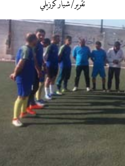
تقيرو /شيار كرزيبي

النهائي كل من فريق معلمي شبراوا وفريق الدفاع والتي انتهت بفوز فريق الدفاع على معلمي شبراوا (٣-٥) بعد التمديد لثوطين إضايفيين وكانت المباراة متكافئة من الطرفين حيث انتهى الوقت الأصلي من المباراة