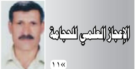
الإعلام الطبي المجاني