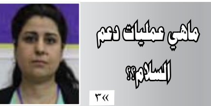
رائحة مديريات دعم السلام