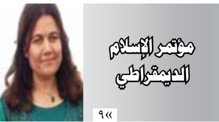
مديرة الإعلام للمؤتمر الإسلامي

أكدت المرأة المشاركة في المؤتمر الأول لمؤتمر المجتمع الإسلامي الديمقراطي، أنه لا بد من توضيح وإزالة الستار عن الفكر الإسلامي الصحيح والعودة به إلى مساره ومنبعه الصافي، ودعوة المرأة المسلمة المؤمنة بالديمقراطية في مجتمع إسلامي أن تكون حرة بفكرها، لتخلص معاً من القيود والأفكار المشوهة التي رسخها مرتزقة داعش في عقول المجتمع «٣»