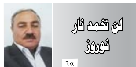
لحم تخمض نار نوروز