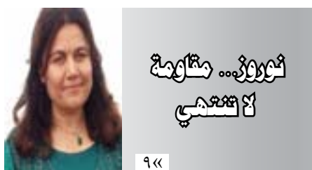
نوروز... عيد الربيع