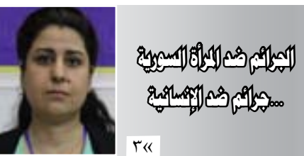
المرأة في الرقة

يمارس كل شخص في المجتمع مهنة معينة، وتكون ذات فائدة عليه وعلى المجتمع وتتطلب مهارات وخبرة وممارسة في ذلك المجال. وفي أغلب الأحيان تتوارث هذه المهنة إلى الأبناء من قبل الآباء.