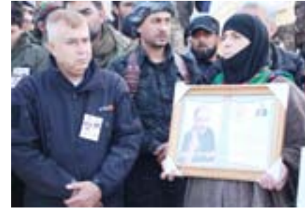
لا شيء يعادل دم الشهيد

استهداف سيارته أثناء عودة سيارته من معارك دحر الإرهاب، بحضور الإدارة المدنية لمدينة منبج، والمؤسسات، من اللجان؛ التابعة لها، فضلاً عن حضور قياديين من جيش الثوار، ومجلس منبج العسكري. وكان قد انطلق منبج مشيرين بأصابع النصر أو الشهداء.