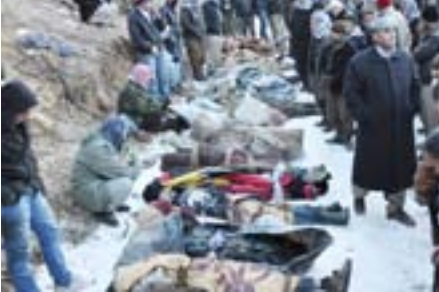
نساء من قرية في كردستان

الأبرز هو القضية الكردية، ويتاريخ ٢٨ كانون الأول ٢٠١١ ألقمت الطائرات الحربية التركية من مطار أمد العسكري باتجاه ولاية شرناق، واستهدفت قنابل الطائرات التركية ومصوريتها قافلة من المدنيين الكرد بينهم أطفال الذين كانوا ينظفون مادة «المزوت» من باشور كردستان، وبالتحديد بين قريتي «روبيوسكي» و«بي جوهي» وهو الأمر الذي أسفر عن مجزرة كبيرة أضيفت إلى المجازر التي ارتكبتها الدولة التركية ضد الشعب الكردي الأزعل طيلة تاريخها الدموي القائم على الإرهاب والانكار والقتل.