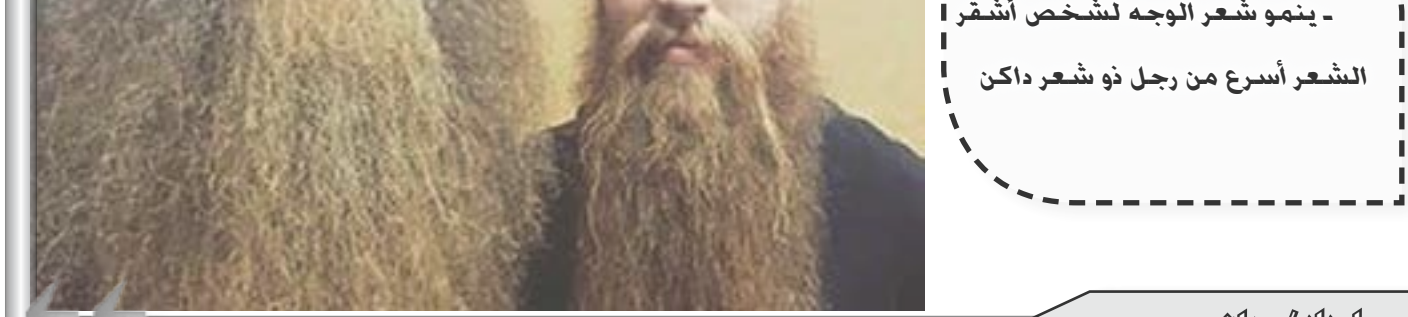
- ينمو شعر الوجه لشخص أشقر

صفر: Cipher لعل واحدة من أهم إسهامات الخوارزمي في الرياضيات هي أنه هو من اخترع رقم الصفر، والكلمة العربية “صفر” هي أصل الكلمة الإنجليزية “ Cipher ” التي تستخدم الان في معظم الأحيان للإشارة إلى علم التشفير، والتي كانت تستخدم بمعنى الصفر حتى القرن التاسع عشر. عوارية: Average الكلمة العربية “عوارية” تعني تلف البضائع أو المنتجات هي أصل الكلمة الفرنسية القديمة “ Avarie “، والتي أصبحت لاحقاً الكلمة الإنجليزية “ Average “. وتعود الكلمة الأصل إلى المسؤولية المالية من البضائع التالفة في البحر، مما أدى إلى حساب المتوسط في القرن التاسع عشر.