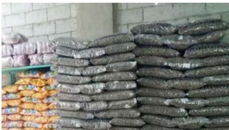
العدد ٦٤٨ www.ronahi.net

روناهي/ الطبقة - يواصل مكتب الصحة والتموين في بلدية الشعب بالطبقة جولاته اليومية على الأسواق والمستودعات والأفران والمطاحن والحمص (محمصة موالح) في المدينة وريفها؛ بهدف الحفاظ على صحة وسلامة المستهلك.