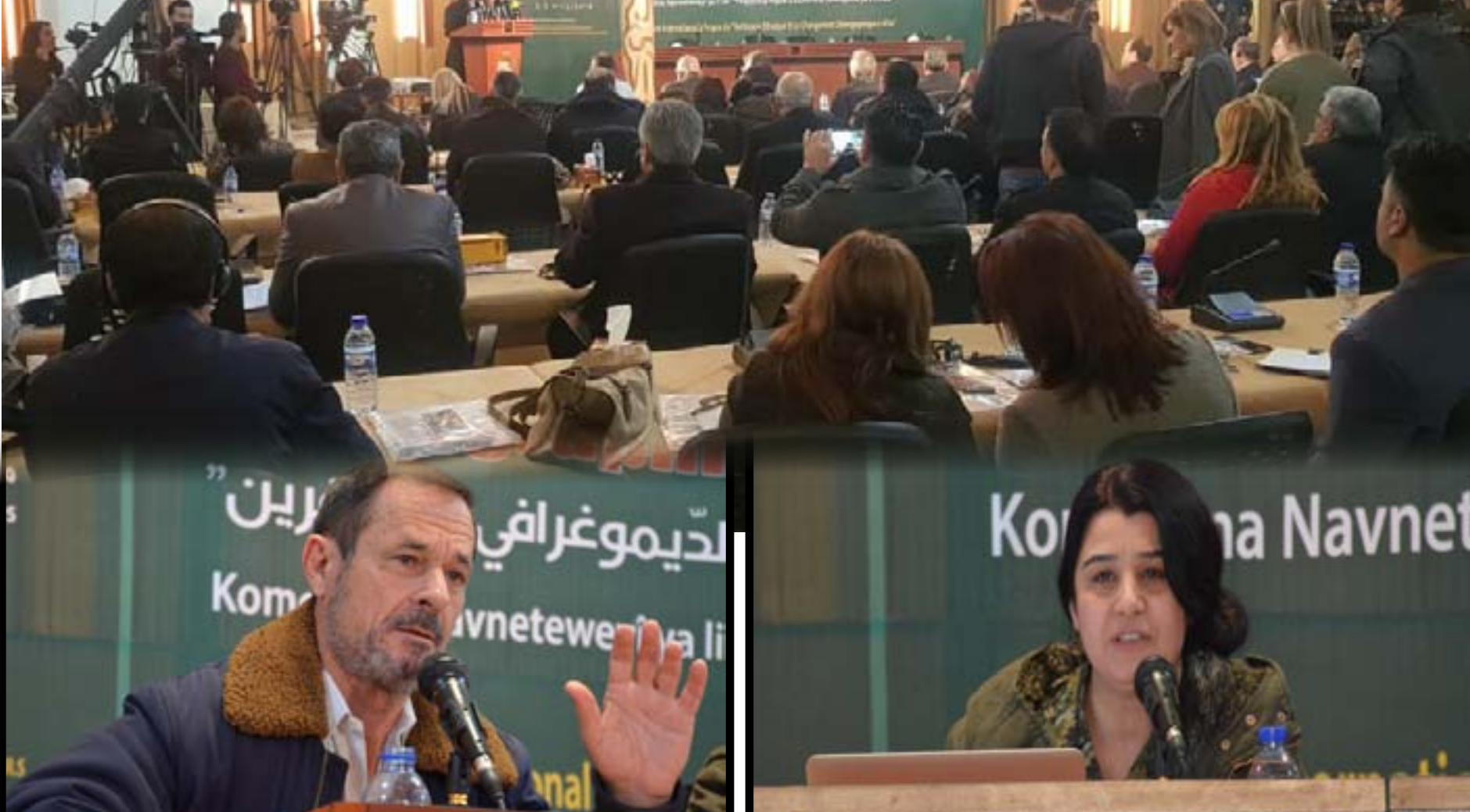
أكد المؤتمر في المنتدى الدولي «حول التطهير العرقي والتغيير الديمغرافي في عفرين»، أن دولة الاحتلال التركي اعتمدت على ذهنية الإبادة والتطهير العرقي تجاه الشعب الكردي في عفرين وتجاه الشعوب الأخرى في المدن السورية التي احتلتها، وأشاروا إلى أنها تعادي الكرد بشكل خاص، وأن أهدافها خلق حالة سياسية وجغرافية ومجتمعية جديدة في المنطقة قوامها الفوضى وإعادة أمجاد سلطنتها العثمانية في الاحتلال والاستبداد، وتدعو بالصمت الدولي حيال هذه الممارسات؛ مؤكدين «ما فعله الاحتلال التركي في عفرين انتهاك للمواثيق الدولية».