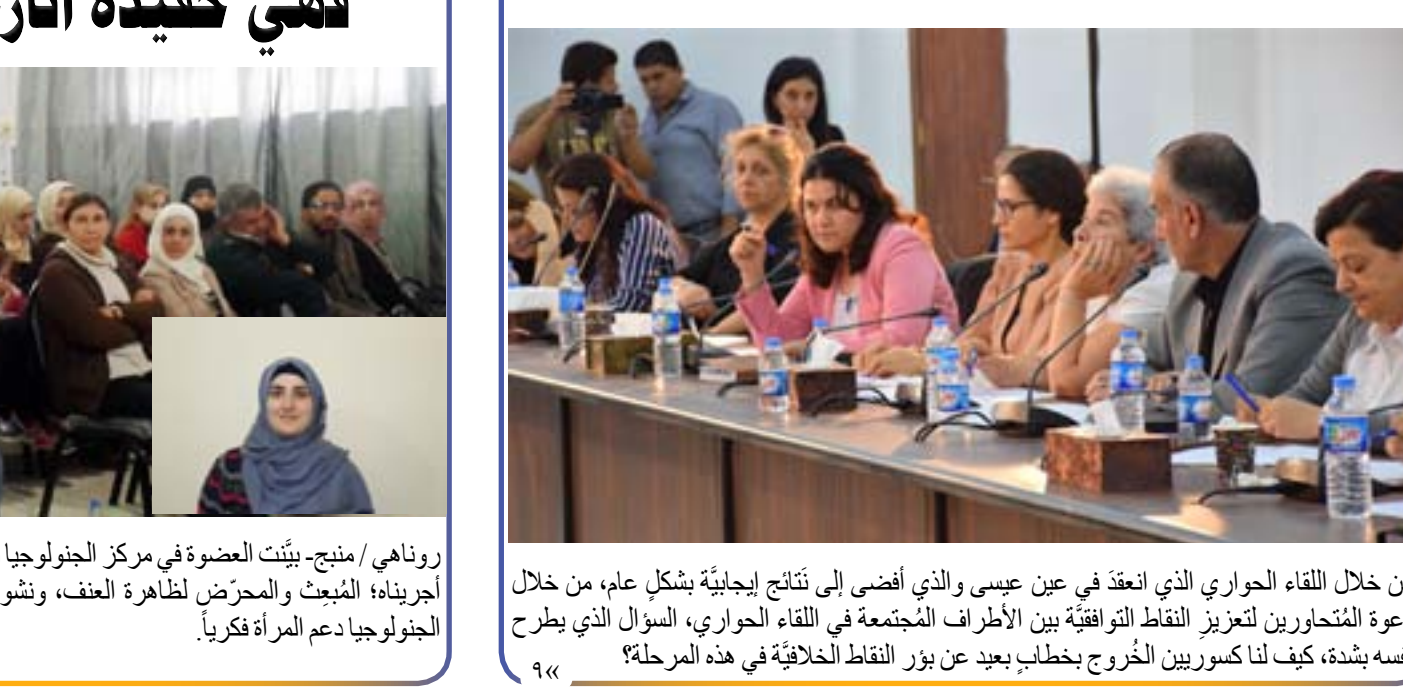
من خلال اللقاء الحواري الذي انعقد في عين عيسى والذي أفضى إلى نتائج إيجابية بشكل عام، من خلال دعوة المتحاورين لتعزيز النقاط التوافقية بين الأطراف المتجمعة في اللقاء الحواري، السؤال الذي يطرح نفسه بشدة، كيف لنا كسوريين بالخروج بخطاب بعيد عن بوز النقاط الخلافية في هذه المرحلة؟