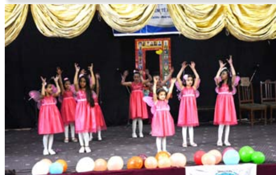
أعمار ١٢ سنة وما فوق بمدينة قامشلو. ويقع في حي قدوريك بقامشلو، وهناك أقر أيضاً وهو في تل تمر، كما يجري التحضير من قبل هيئة العمل والشؤون الاجتماعية لافتتاح مركز يستوعب الخاصة في كل عام في الثالث من