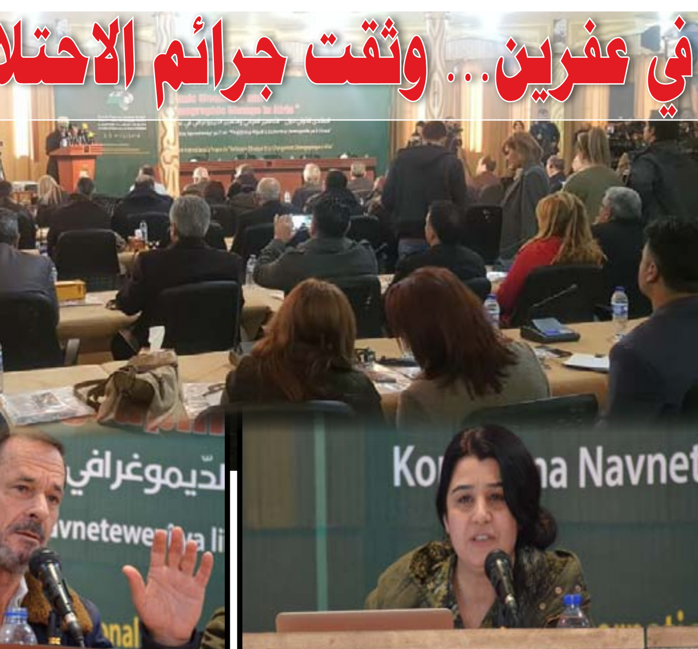
أكد المؤتمر في المنتدى الدولي «حول التطهير العرقي والتغيير الديمغرافي في عفرين»، أن دولة الاحتلال التركي اعتمدت على ذهنية الإبادة والتطهير العرقي تجاه الشعب الكردي في عفرين وتجاه الشعوب الأخرى في المدن السورية التي احتلتها، وأشاروا إلى أنها تعادي الكرد بشكل خاص، وأن أهدافها خلق حالة سياسية وجغرافية ومجتمعية جديدة في المنطقة قوامها الفوضى وإعادة أمجاد سلطنتها العثمانية في الاحتلال والاستبداد، وتدعو بالصمت الدولي حيال هذه الممارسات؛ مؤكدين «ما فعله الاحتلال التركي في عفرين انتهاك للمواثيق الدولية».

سياسية ثقافية عامة - تصدر عن مؤسسة روناہی للإعلام والنشر - ٥٠ ل.س. العدد ٦٢١ - الأربعاء ١١/٢/٢٠١٨م