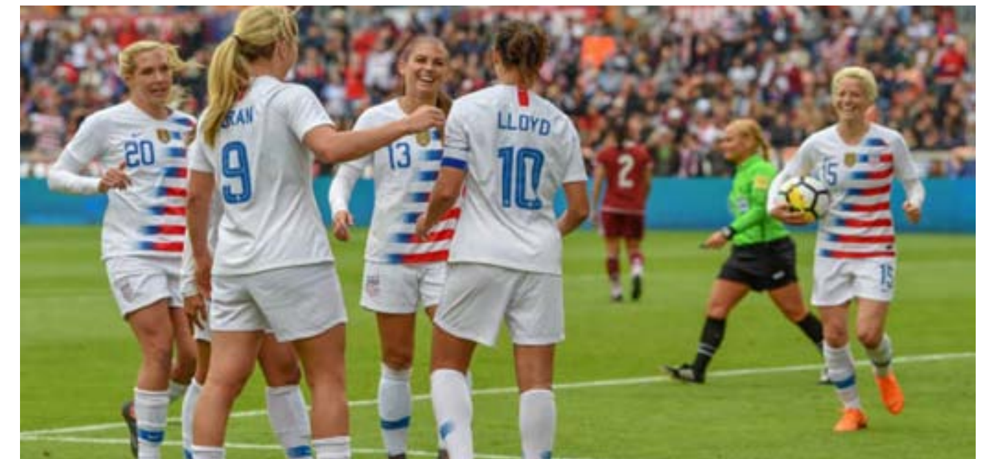
مع أستراليا وبلجيكا في ولايتي كولورادو وكاليفورنيا، قبل أن يختم جدول الوديات بمواجهة جنوب إفريقيا ونيوزيلندا والمكسيك أيام ١٦ و٢٠ من شهر أيار المقبل في ولايات كاليفورنيا وميسوري ونيوجيرسي. يذكر أن منتخب أمريكا يتواجد في المجموعة السادسة بكأس العالم للسيدات ٢٠١٩م، في فرنسا، مع منتخباتي تشيلي وتاييلاند والسويد.

كانون ثان المقبل، لمواجهة منتخبتي فرنسا وإسبانيا، على ملاعب المنتخبين الأوروبيين، يومي ١٩ و٢٠. وفي أواخر شهر شباط ستنتظم أمريكا البطولة الودية السنوية للمنتخبات النسائية (كأس شيلينغز) وستشهد الأشهر الـ ٦ خوض المنتخب ١٠ مباريات ودية داخل أمريكا وخارجها، حيث ستبدأ رحلة الوديات من قارة أوروبا في شهر