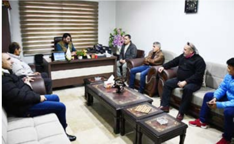
تقرير/ جوان محمد

وتحضيراته لمرحلة الدور النهائي في الدوري السوري الممتاز، وأهم النقاط التي تُوِّقت كانت تأمين الملعب لمران النادي، بالإضافة لتفريغ اللاعبين للاعتماد بتمارين ومباريات النادي بالإضافة إلى تقديم الدعم المادي المطلوب له، من جانبه الاتحاد الرياضي أكد على تقديم كافة أنواع الدعم للجهاد بحسب الإمكانيات المتوفرة،