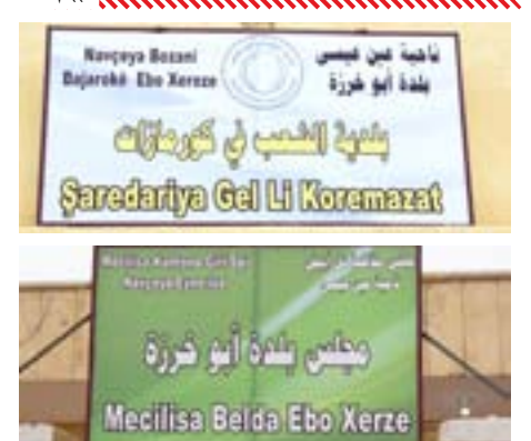
يواصل مجلس الشعب في بلدة أبو خريزة التابعة لناحية عين عيسى العمل في كافة المجالات لخدمة الشعب وتوفير الخدمات لأهالي المنطقة