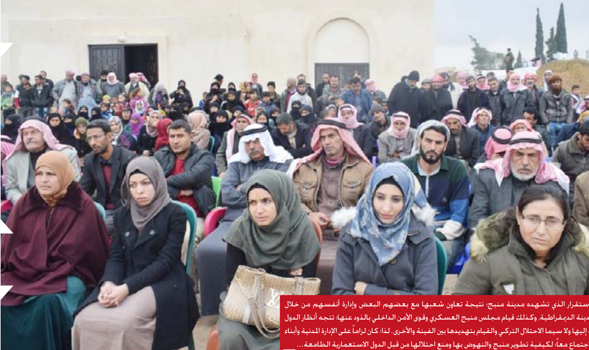
تظراً للاستقرار الذي تشهده مدينة منبج، نتيجة تعاون شعبها مع بعضهم البعض وإدارة أنفسهم من خلال الإدارة المدنية الديمقراطية. وكذلك قيام مجلس منبج العسكري وقوى الأمن الداخلي بالدور عنها، تنجبه أنظار الدول الخارجية إليها ولا سيما الاحتلال التركي والقيام بتهديبها بين الغيمة والأخرى. لذا، كان لزاماً على الإدارة المدنية وأبناء منبج الاجتماع معاً، لبحث كيفية تطوير منبج والنهوض بها ومنع احتلالها من قبل الدول الاستعمارية الطامعة...