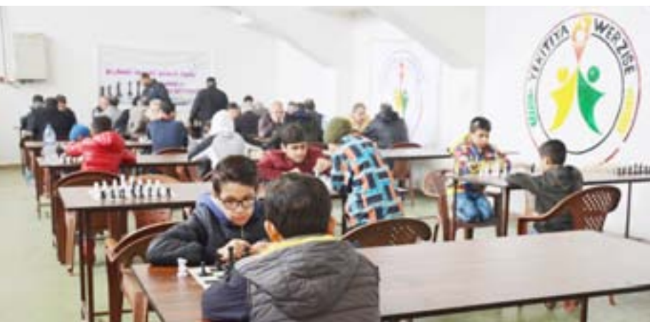
بطولة قامشلو المفتوحة للشطرنج قفزة نوعية من خلال مشاركة أكثر من خمسين لاعبة ولاعب،

الفئة والطائفية بين هذه الشعوب، التي تتمسك بروح المحبة والتآخي فيما بينها، واختيتمت البطولة بالنتائج التالية: