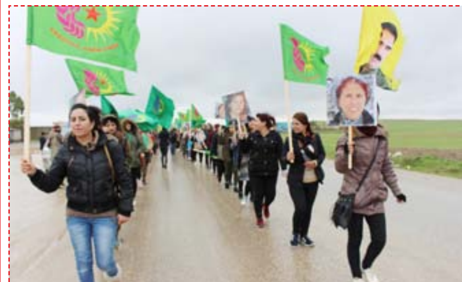
أكدت شبابت انضممن إلى المسيرة التي نظمها اتحاد المرأة الشابة في ديرك للتنديد بالاحتلال التركي والانتفاضة من أجل قائد الأمة الديمقراطية عبد الله أوجلان فمن سيواصل مسيرتهن التضالية في وجه الاحتلال وسيبرهن نحو نهج القائد أوجلان ونهج الشهداء الأحرار