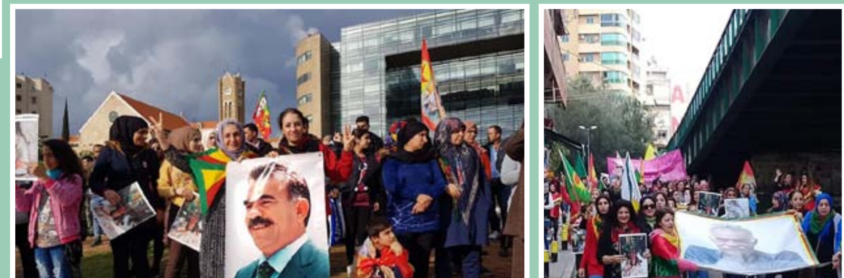
نظمت رابطة نيوروز بالتعاون مع منظمة المرأة مؤتمر سنا: تظاهرة جماهيرية أمام مقر الأمم المتحدة في بيروت، للتنديد بالعزلة الغير قانونية المفروضة قسراً على المفكر الكردي وقائد الأمة الديمقراطية العجفل منذ ٢٠ عاماً في جزيرة إمرالي التركية. قائد الشعوب النواقة للحرية القائد عبدالله أوجلان.